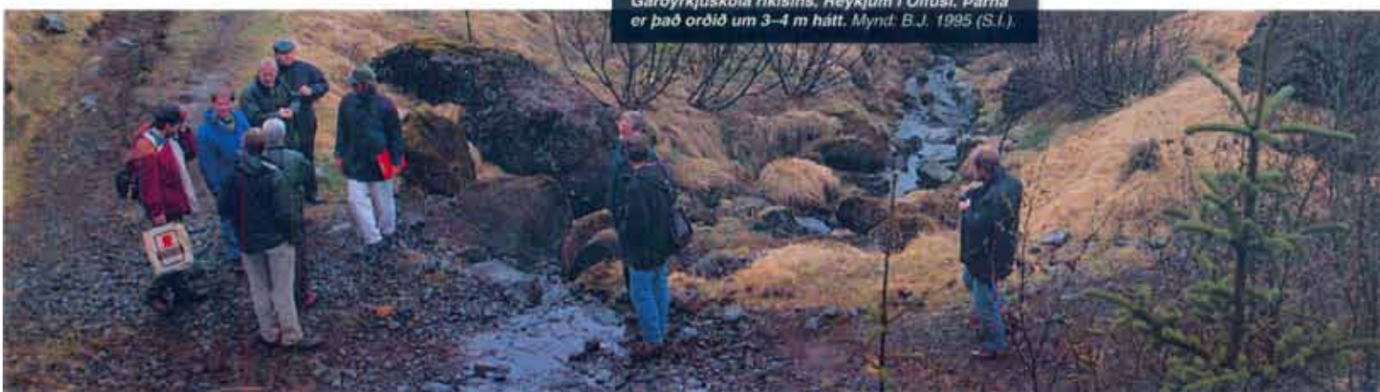
Eldra sitkælni, gróðursett um 1985, í gili við Garðyrkjuskóla ríkisins, Reykjum í Ölfusi. Þarna er það orðið um 3-4 m hátt. Mynd: B.J. 1995 (S.I.)