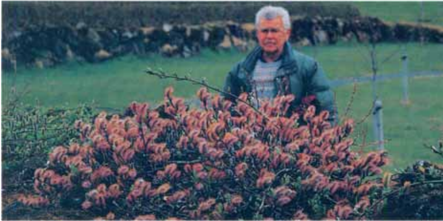
'Bústi', ný skriðul víðitegund á markaðnum. Mynd: B.J. 1995 (S.Í.).