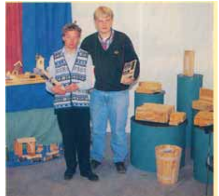
Úr sýningarbás handverkstæðisins Ásgarðs sem framleiðir leikföng og ýmsa nytjahluti úr íslenskum víði.