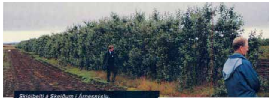
Skjólbelti á Skeiðum í Árnessýslu.

Ljóst er að með þessu verkefni er verið að stíga stórt framfaraskref í búskaparsögu hér á landi þar sem við erum að tileinka okkur enn frekari ræktunarbúskap en áður hefur verið.