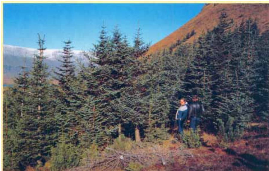
Úr Hamrahlíð.