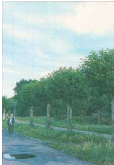
Fallega klipptar alaskaaspir (eða balsamaspir) í miðborg Viborg í Rússlandi. Þessi klipping kallast „pollarding“ og er algeng í garðrækt í Evrópu. Þetta form fæst ekki nema með reglulegri klippingu trjánna. Vanhugsaðar toppstýfingar geta hins vegar eyðilagt trén.

Töluvert hefur borið á því að undanförunu að garðeigendur og garðyrkjumenn toppstýfi stórar alaskaaspir í gördum. Afar mikilvægt er að fólk geri sér grein fyrir því hvaða afleiðingar þetta hefur í för með sér. Þetta getur auðveldlega valdið varanlegum skemmdum á gömlum trjám. Á meginlandi Evrópu er gömul hefð fyrir því klippa ofan af trjám og halda þeim þannig í ákveðinni hæð. Kallast aðferðin á ensku „pollarding“ sem hefur verið kölluð stýfing eða kollun hér á landi.