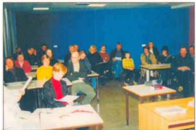
Fjölmenni var í Grunnskólanum í Þorlákshöfn á stofnfundi Skógræktarfélag Þorlákshafnar og Ölfuss.

Í vor var haldinn í Þorlákshöfn fjölsóttur stofnfundur skógræktarfélag Í Ölfusi. Félagið hyggst meðal annars beita sér í skógrækt og landgræðslu á söndunum ofan við Þorlákshöfn. Þar hefur verið gróðursett töluvert undanfarin ár með góðum árangri og því áhugavert að reyna að stórauka þær framkvæmdir. Ættu vegfarendur að taka eftir vöxtulegum trjám á vinstri hönd þegar ekið er í átt að Þorlákshöfn. Einnig hyggst félagið beita sér fyrir aukinni skógrækt á starfssvæðinu og fyrir aukinni trjærækt í Þorlákshöfn.