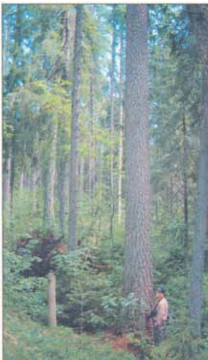
270 ára gömul lerkitré eru orðin býsna væn. Hér sést einn rússneski lerkirisinn í Raivola, um 50 m há.

Árið 1738, nokkru eftir dauða Péturs mikla, sáði síðan þýski skógræðingurinn Fockel rússalerkífræi í jarðunnið land. Elsti hluti skógarins er því nú 264 ára gamall og hæstu tré liðlega 50 metrar. Stærsti hluti þess rússalerkis sem hefur verið gróðursett í Finnlandi og hér á Íslandi er af Raivola uppruna, þó oftast úr frægörðum þar sem móðurtrén eru af Raivolastofni. Betur verður fjallað um þessa ferð í Skógræktarritinu.