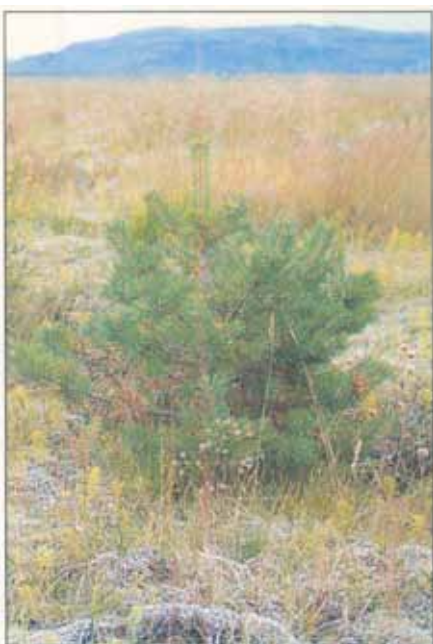
Falleg skógarfura vex áfallalaust í mounum í Mosfelli í Grímsnesi.