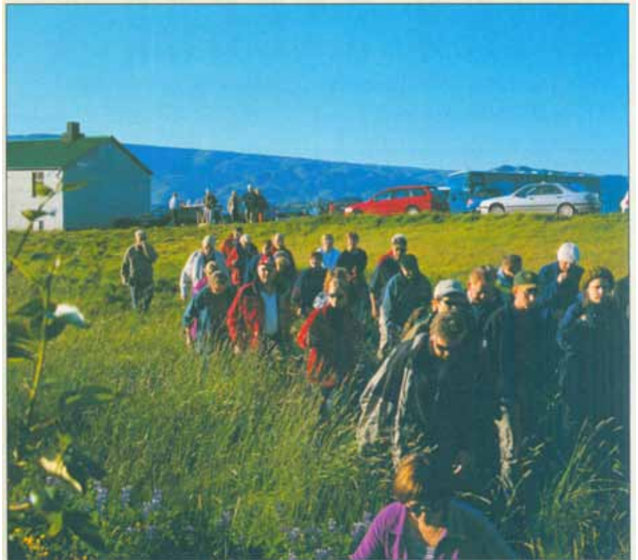
Skógræktarfélagin í Kópavogi, Kjósarsýslu, Kjalarnesi og Mosfellsbæ eiga sameiginlega skógræktarjörðina Fossá í Hvalfirði. Þar var haldin fjölmenn skógarganga núna í sumar og var hún liður í fræðslusamstarfi skógræktarfélaganna og Búnaðarbankans