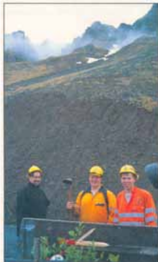
Starfsmenn Vegagerðarinnar á Ísafirði og Skógræktarfélags Íslands gróðursettu um 500 plöntur í Óshlíð núna í júní. Það var gert með öflugum plöntuhökum, eins og þeir sjást munda á myndinni. Efstu plöntur voru gróðursettar nærri skóflunum sem sjást efst á myndinni.

Í síðasta Laufblaði var sagt frá göðum árangri við sáningu lúpínu í Óshlíðina og bent á mikilvægi þess að hefjast handa við ræktun trjágróðurs samhliða því.