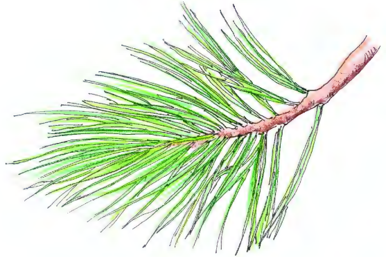
Nálar lindifuru eru langar og mjúkar viðkomu.

Sumir höfundar aðgreina lindifuru í tvær aðskildar trjátegundir, sembrafuru ( P. cembra ) og lindifuru ( P. sibirica ) en aðrir sem undirtegundir ( P. c. subsp. cembra og P.c. subsp. sibirica ).