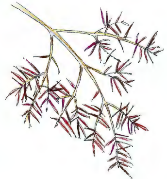
Sitkalús getur valdið skemmdum á blágrenitrjám

Undantekning er þó að lúsín drepi tré, en hún getur dregið úr vexti þeirra í slæmum lúsaárum. Til að sporna gegn lúsinni þarf að gæta þess að tré standi ekki of þétt í skógarlundum, því það gerir lífsskilyrðin betri fyrir hana. Hún kann best við sig í dimmu og raka og á hún þá einnig auðveldara með að komast á milli trjáa í þéttum lundum. Því er það helst til ráða að grisja skógarreit, ef lús kemur upp í þeim. Hæpið er að fara út í úðun á skógarreitum sem hafa meira en nokkra tugi trjáa. Komi hins vegar lús á stök tré í gördum er sjálfsagt að úða gegn henni. Þannig er hægt að halda henni algerlega í skefjum.