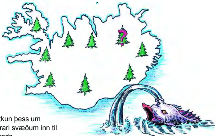
Sitkagreni hentar um nær allt land

Sitkagreni hefur verið ræktað með ströndinni allt í kringum landið með ágætum árangri og þar sem nær dregur sjó tekur það öðrum sígrænum trjátegundum fram. Má því mæla með notkun þess um allt land, þó síst á þurrari svæðum inn til landsins norðaustanlands.