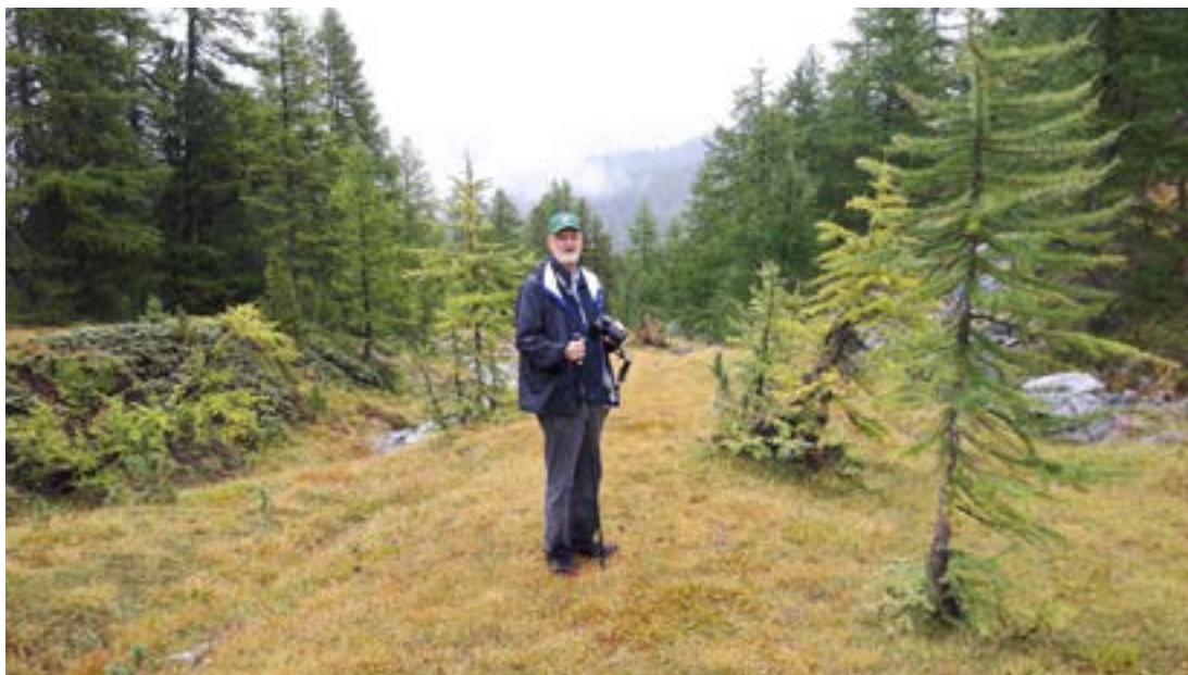
Söngstjórimm við skógarmörk ekki svo ýkja langt frá fjallaskarðinu Col d'Izoard.