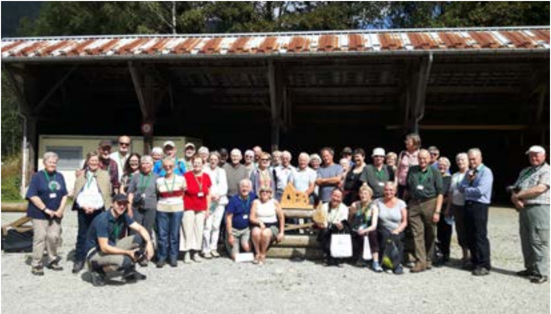
Ferðalangarnir ásamt frönskum gestgjöfum frá Skógræktinni í Beaufort.

ferkílómetrar að stærð; þar af eru aðeins 0,2% upprunalegir skógar eða náttúruskógar. Þar er því fyrst og fremst að finna manngerða skóga og teljast nytjaskógar vera um 98% af skógum Frakklands. Er eignarhald þeirra með þeim hætti að 74% þeirra er í einkaeigu en 26% í opinberri eigu.