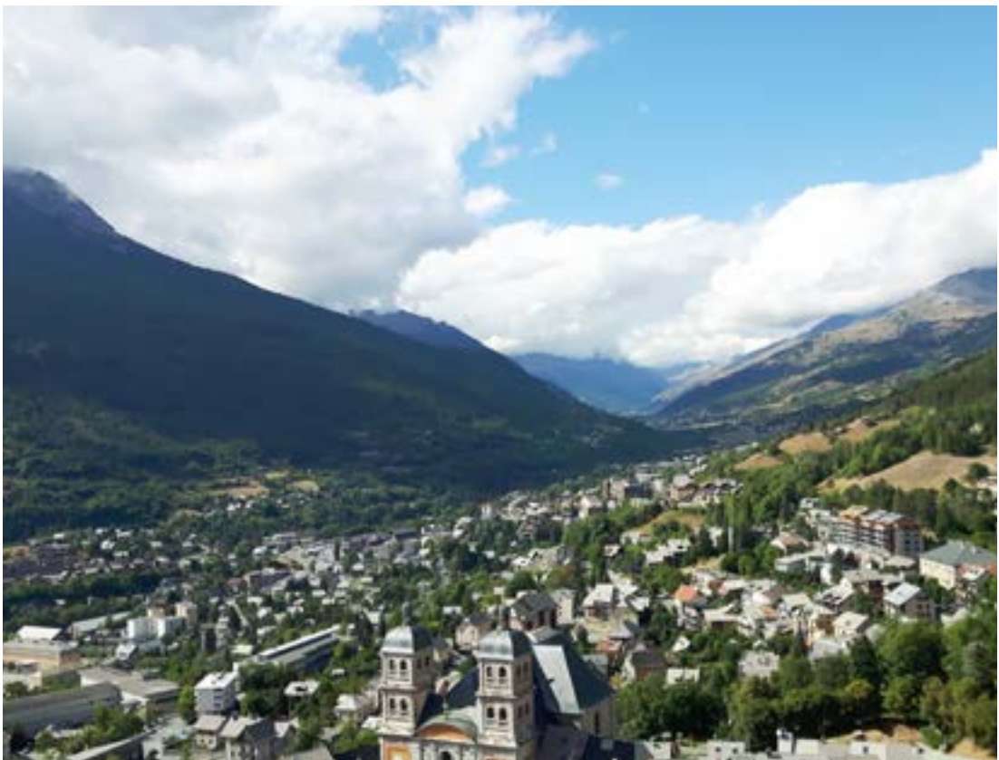
Yfirlitsmynd frá kastalanum yfir bæinn Briançon.