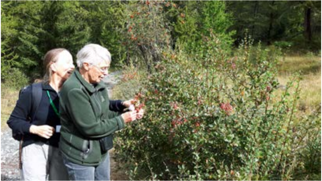
Hjá þessum glaðbeittu stöllum gildir að láta ekki happ úr hendi sleppa.