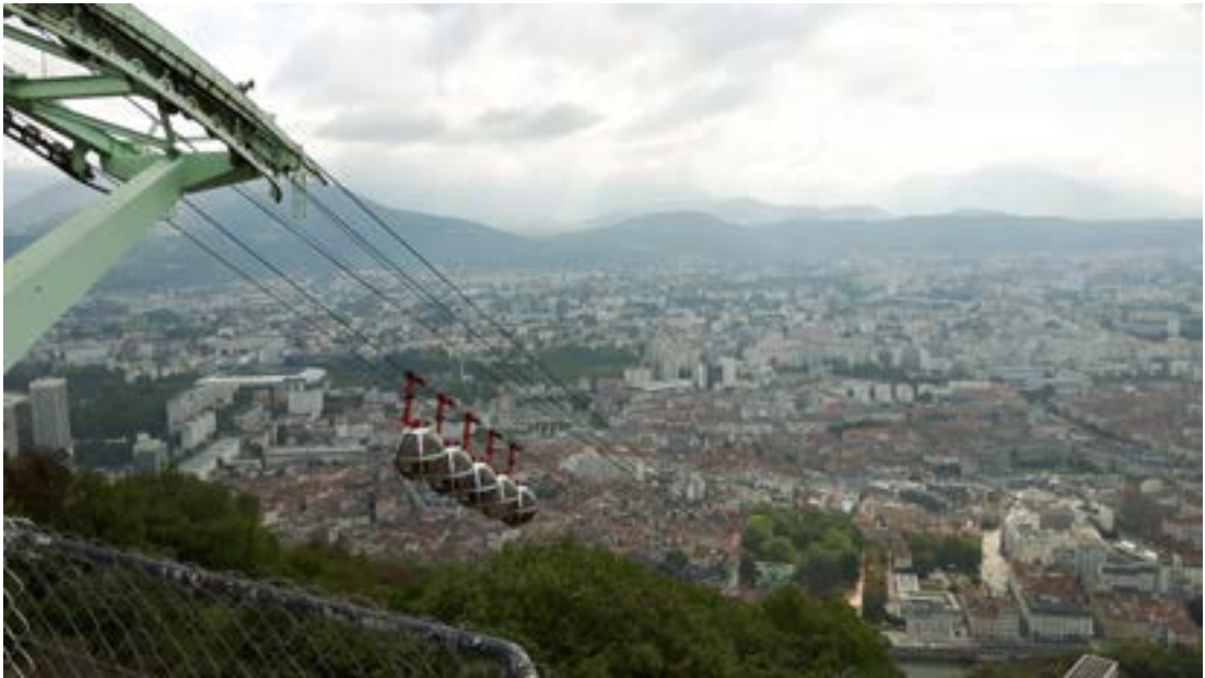
Séð yfir Grenoble frá fornu virki ofan bæjarins en þangað koma flestir svífandi í þessum sérkennilegu kúlum.