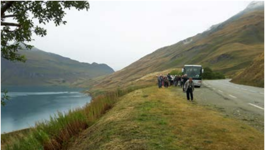
Áð við uppistöðulónið Lac du Mont Cenis.