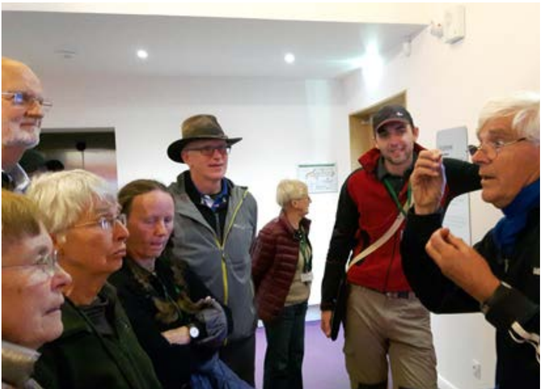
Forstöðumaður jarðfræðisafnsins vildi fyrir alla muni að við áttuðum okkur á jarðfræðisögu Frakklands.