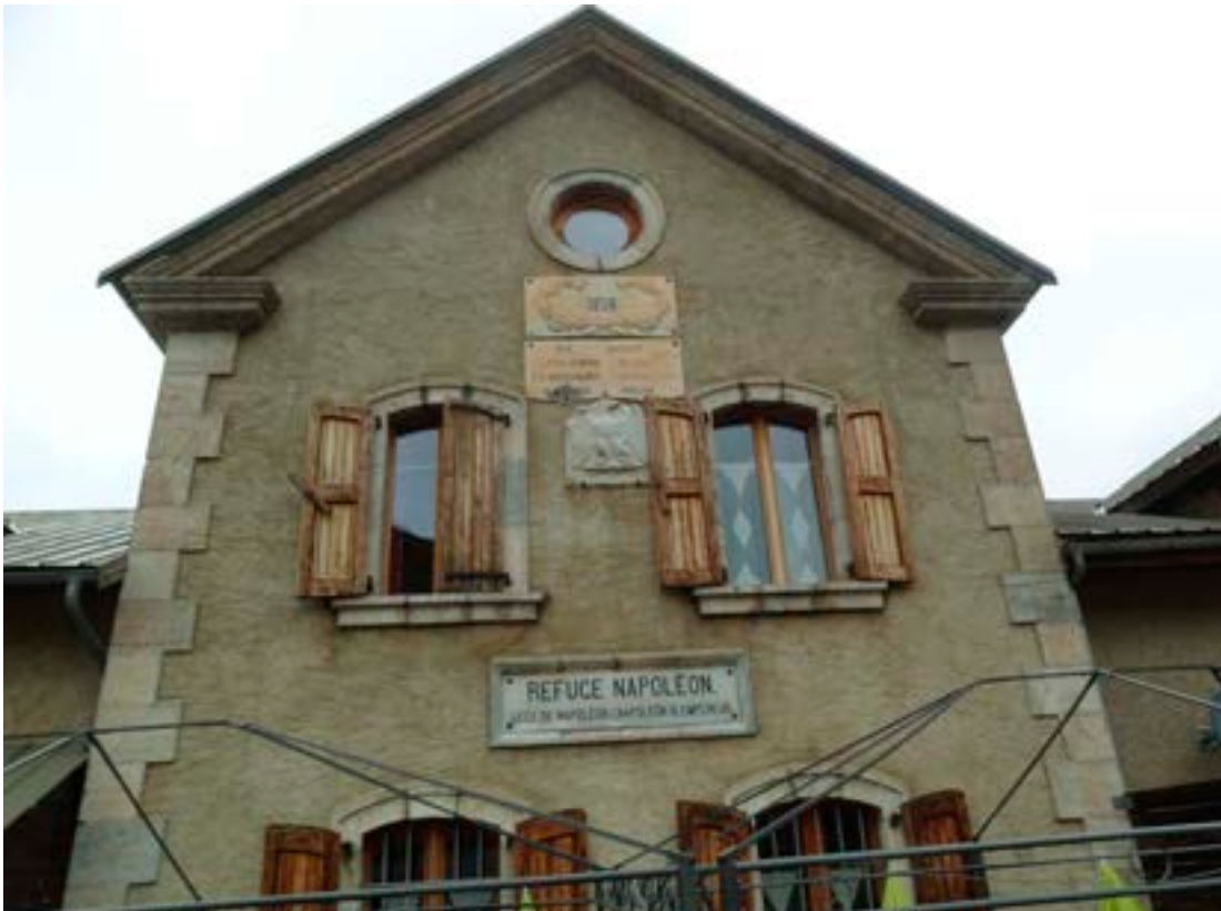
Sæluhús keisarans.

Í þoku og rigningu komu sér fljótlega í skjól í sæluhúsi Napoleons, sem hann lét á sínum tíma reisa fyrir ferðalanga eins og okkur. Var þar boðið upp á hina herlegustu steik og eftirrætti. Áttum við því láni að fagna að eigandinn hafði veður af komu okkar og lét sig ekki muna um að stíga á stökk og segja okkur sögu hússins og nágrennis. Þökkuðum við þessa óvæntu uppákomu með nokkrum hressilegum íslenskum lögum, svo undirtók í höll Napoleons. Fyrir vikið rann enn betur úr rauðvínskútum eigandans á alla línuna þar til Gabriel fararstjóra leist ekki lengur á blikuna. Var þá haldið að nýju á vit nýrra ævintýra og komið við á landbúnaðarmarkaði héraðsins í þorpinu Château-Ville-Vieille í Queyras. Reyndar var nú farið að síga á seinni hluta sýningarinnar í sumum básum, hvort sem það var nú veðrinu um að kenna eða því að