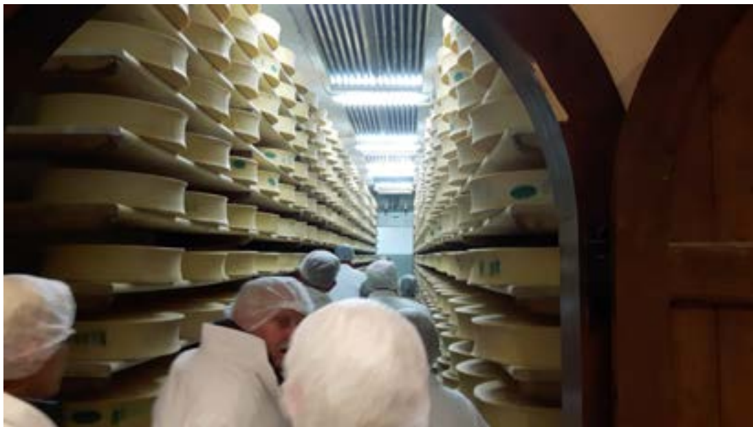
Verðmætir bleifar Beaufort-ostanna eru geymdir við kjöraðstæður og virði þeirra er um 70 þúsund krónur stykkið. Það þarf all marga lítra frá mjaltþjörkum eins og hér til hægri til að framleiða 1 kg af gæðaosti.