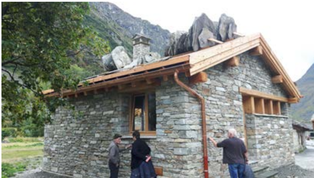
Í Bonneval eru öll hús byggð úr steini og þar eru ný hús engin undantekning. Mynd: BJ