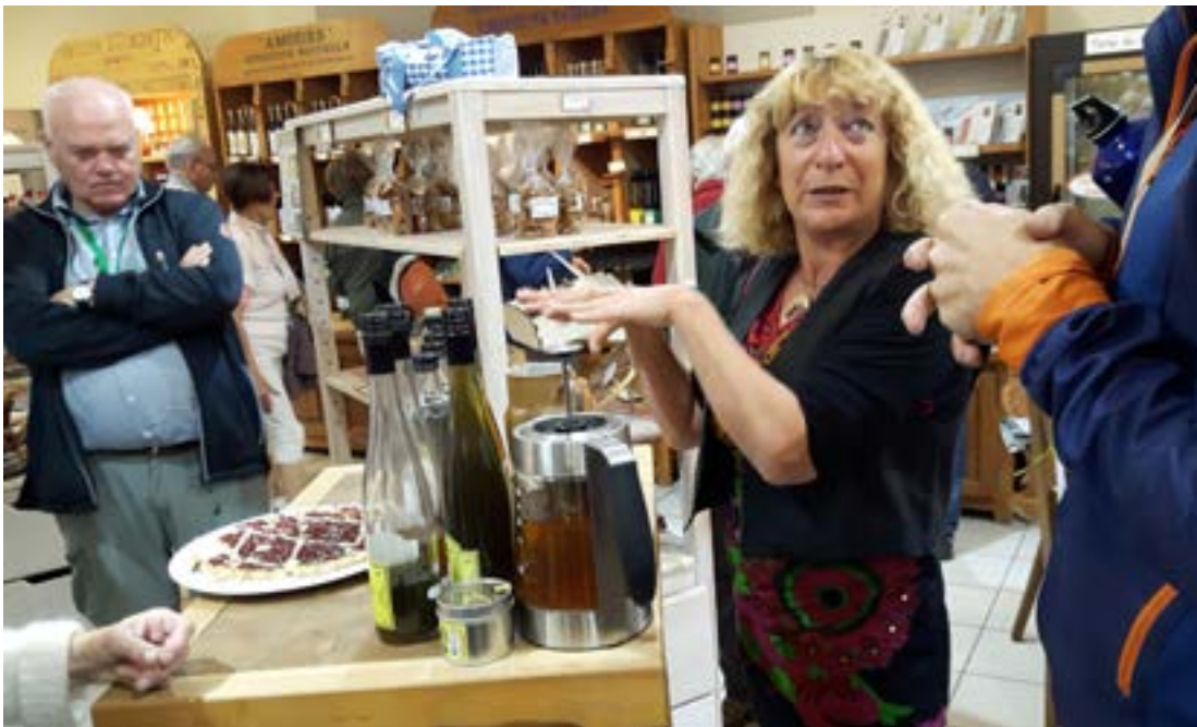
Á handverks- og vörumarkaði var að finna nánast allt sem hugurinn girntist, m.a. lerki-, sembra- og bergfurusnafsa, auk allskyns annars góðmetis.