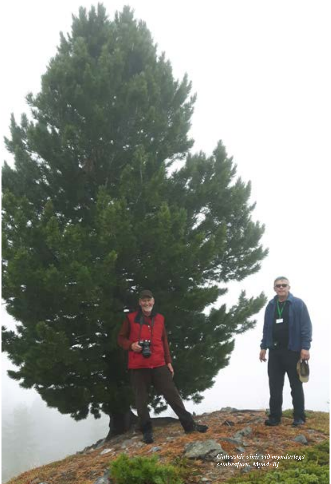
Galvaskir vinir við myndarlega sembrafuru.