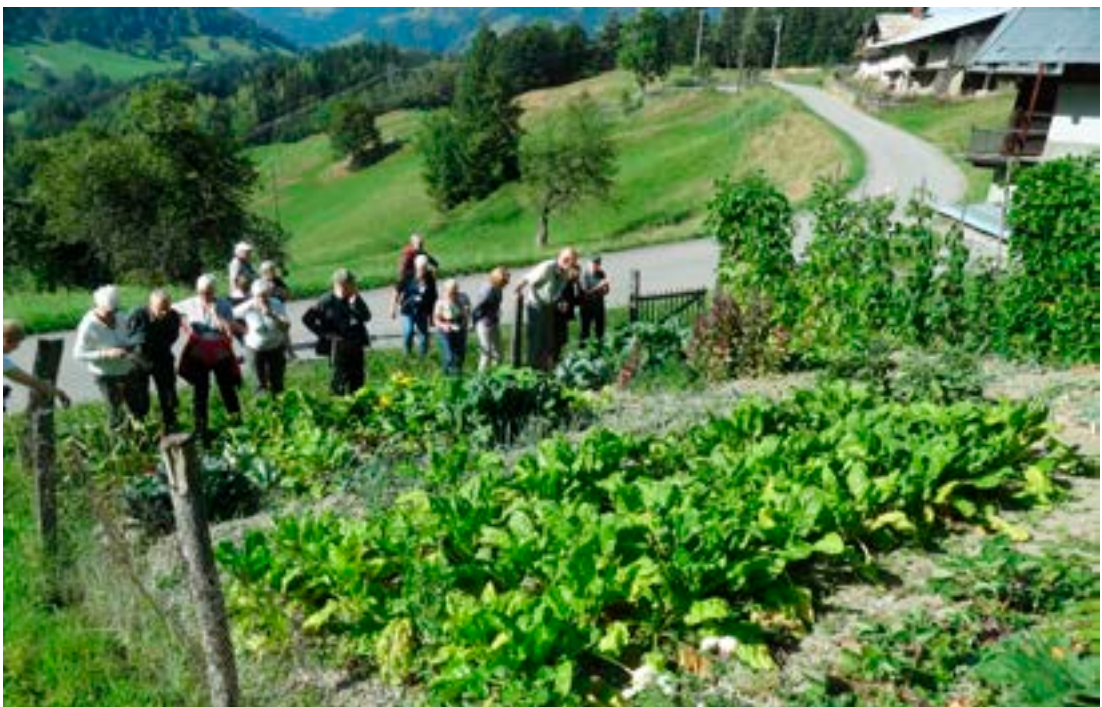
Búsetulandslag og heimagarður.

upp dalinn og á brekkuna allt að næsta viðkomustað, bænum Beaufort. Hér vorum við komin í hjarta ostagerðar í Frakklandi og við tók yfirgripsmikil fræðslusýning. Hópnun var skipt upp í minni hópa og