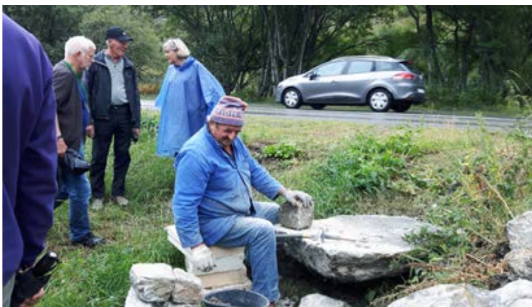
Þessi steinsmiður sagði fátt en vakti athygli okkar. Það er seinlegt verk að móta hvern einasta stein en þannig hefur hins vegar bærinn Bonneval verið byggður frá fyrstu tíð.

sigursælir undanfarin ár. Að lokinni skoðunarferð um Bonneval og skógivaxnar hlíðar mikilla fjallasala var haldið heim á hótél þar sem enn var snætt ljúffengt fondu