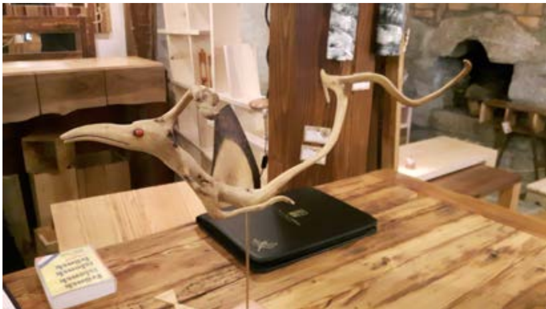
Hér tekur myndunaraflíð á rás.

Napoleon Bonaparte, sem báðir fóru hér um með vöskum sveitum. Það er í sjálfu sér með ólíkindum að hér hafi Hannibal farið með Afríkufíla, tvöhundruð árum fyrir Kristburð, yfir veglaus fjallaskörð og einstigi enda mun það hafa verið svo að aðeins örfáir stríðsfílar komust lifandi niður á sléttur Ítalíu. Margt hefur verið skrifað um Napoleon en það kemur kannski flestum á óvart að hann stóð fyrir löggjöf sem leiddi til þess að regluverk var sett um skógvernd og nýtingu þeirra. Á átjándu öld var svo komið að gengið hafði verið ótæpilega á skóga í Frakklandi og um hálfgerða rányrkju víða að ræða. Löggjöf sú sem Napoleon kom á, Code Napoleon, markaði auk annars afgerandi spor sem leiddu til skynsamlegrí nýtingar á skóguni í Frakklandi.