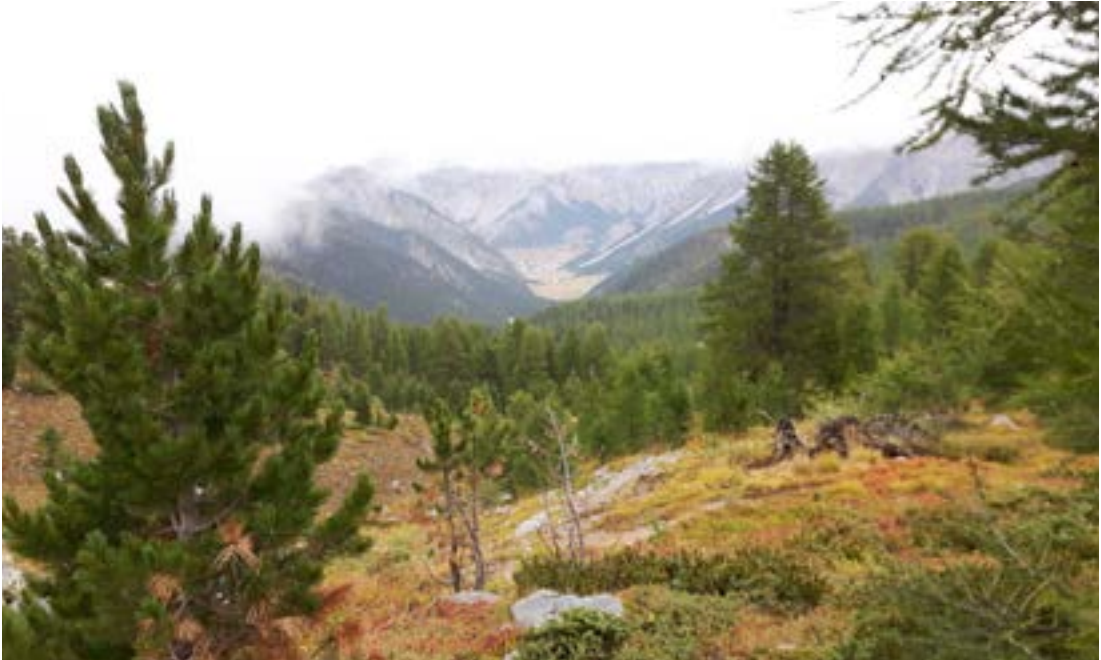
Séð niður dalinn frá efstu skógarmörkum að þorpinu Cervières.

dalnum og þjónuðu á sínum tíma hernaðarlegum tilgangi.