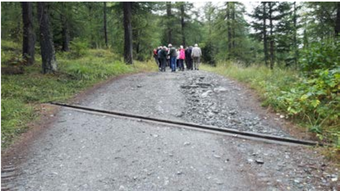
Vatnsrásir spara viðhald á vegum og stígum.

að finna á sama svæði kapellu tileinkaða dýrlingnum Sebastian. Í kirkjunni er að finna freskur frá 15. öld sem lýsa lífi Krists sem eru eins og þær hefðu verið gerðar í gær. Altari og aðrar töflur vöktu sérstaka