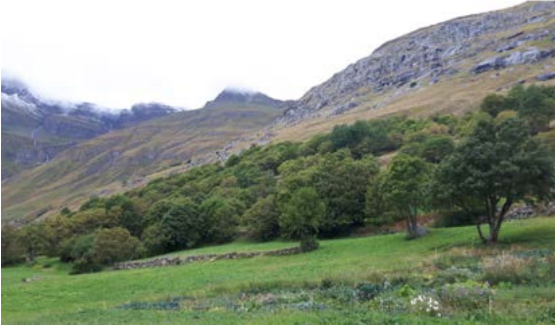
Ofan við Bonneval í yfir 1.850 m hæð er fallegur laufskógur, aðallega hlynur.

viðnum. Stórmerkilegt er hversu vel þessi verk hafa varðveist, nær óbreytt eftir fleiri hundruð ár. Þegar þessari fróðlegu messu lauk að tveim tímum liðnum hafði styt upp og var haldið ofar í dalinn þar sem tóku á móti okkur tveir galvaskir leiðsögumenn. Var hópnum skipt upp í tvo hópa eftir erfiðleikakvarða og gengið eftir stígakerfi skóganna, sem voru all fjölbreyttir. Fyrst og fremst lauftré í dalbotninum meðfram ánni, sem var kolmórauð eftir úrkomu næturinnar. Þegar lengra kom upp í hlíðar dalsins varð greni og lerki áberandi. Auk þess var að finna runna og aðrar trjátegundir í jöðrum og brúnum sem margir veittu athygli og gerðu sig jafnvel heimakomna við ávexti og ber sem virtust hæfilega þroskuð við nánari skoðun. Allt gekk að óskum í þessari gönguferð hjá báðum hópum þar til að rútan var að renna af stað en þá uppgötvaðist að tvær heiðurskonur höfðu ekki skilað sér. Upphófst nokkur rekistefna af þessu tilefni og komu fram tvær kenningar um afdrif. Þeirri fyrri, að þær væru svo ölkærar og hefðu þefað