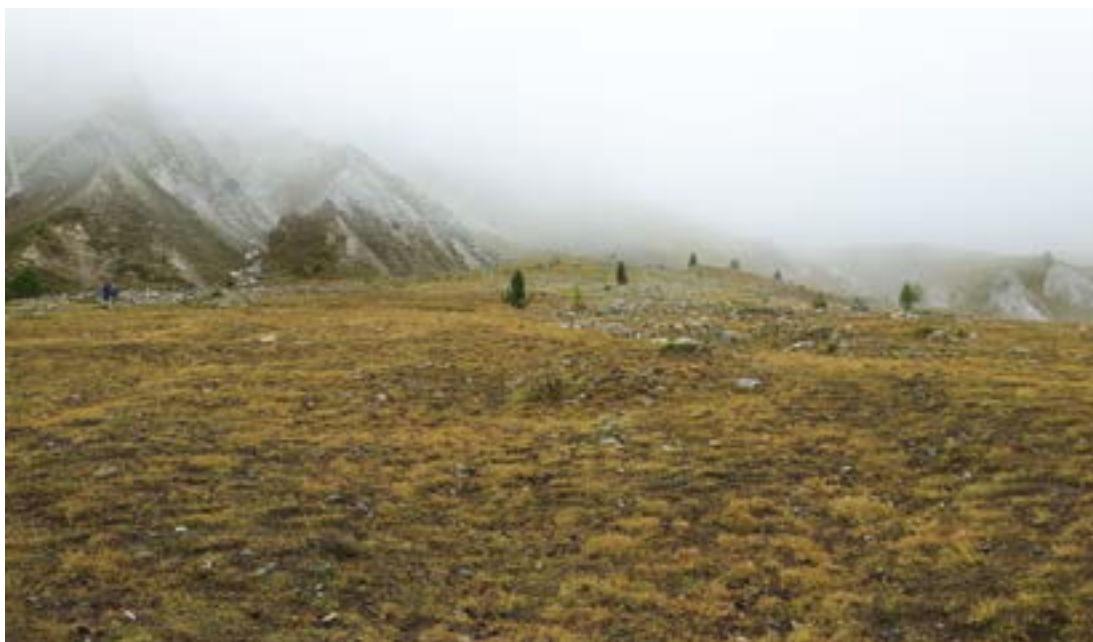
Ofan skógarmarka eru einstaka lerki og sembrafurur á stangli.

öld. Á þeim tíma er kastalinn var byggður vörðust menn Austurríkismönnum, sem á þeim tíma réðu m.a. yfir allri norður Ítalíu. Innan veggja kastalans var svo bær