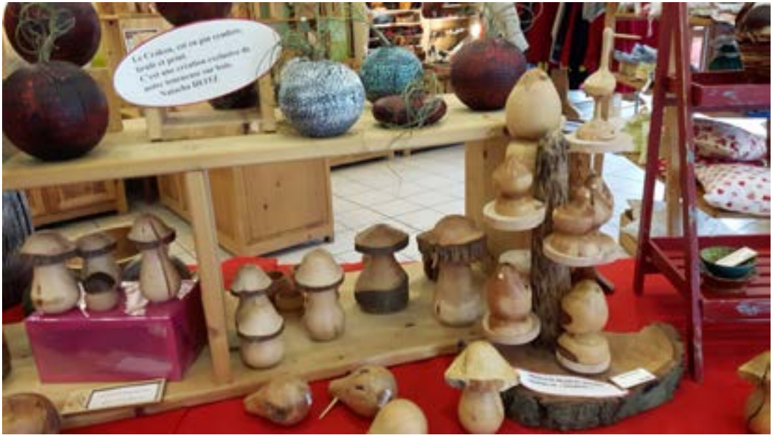
Gjafavörur unnar úr viðarafurðum heimamanna.