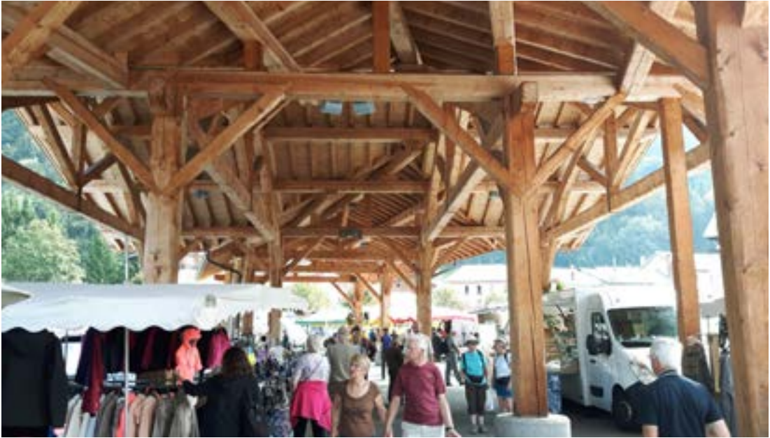
Vandað mannvirki reist með heimaefngnum efniviði til skjóls á vörumarkaði í Beaufort.

osturinn gera hann að þeirri vöru sem fræg er orðin. Þarna eins og víðar var hins vegar farið að nota þjarka sem koma í stað mannshandarinnar við umstöflun á ostunum sem þarf að hreyfa reglulega. Ef allt á að ganga upp þarf samt að fylgjast vel með öllum þáttum. Alls eru fimmtán sel af svipaðri gerð í héraðinu; samlög bænda þar sem Beaufort ostarnir eru framleiddir. Þótti mönnum fróðlegt að sjá hvernig hægt er að breyta venjulegri mjólk í þessa gæðavöru. Allir sem vildu fengu síðan að smakka á mismunandi gerðum osta og vættu kverkarnar með eðalvínum, rauðum og hvítum allt eftir smekk. Uppruni ostanna er náttúrulega kýrnar sem haldið er í haga í fjöllum og hlíðum héraðsins. Daginn eftir stoppuðum við hjá einum slíkum haga þar sem kúnum er smalað á mjaltþjarka og mjólkinni síðan ekið sem leið liggur. Greinilegt er að hér er um mjög öflugt og þróað afurðarkerfi að ræða þar sem hver hlekkur tekur við af öðrum. Þegar þessari fróðlegu kynningu var lokið var haldið áleiðis lengra inn dalinn að dvalarstað okkar þá nóttina, að