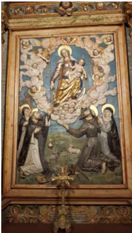
Maríumynd frá 15. öld í kirkju í Lanslevillard. Sembrafuran er með þeim eiginleika að hvorki mólur né ryð fá henni eytt og því hefur hún verið notuð í kirkjumuni, altarástóflur og freskur.

snúa undan sól eru yfirleitt skógivaxnar. En auðvitað er þetta ekki algild regla.