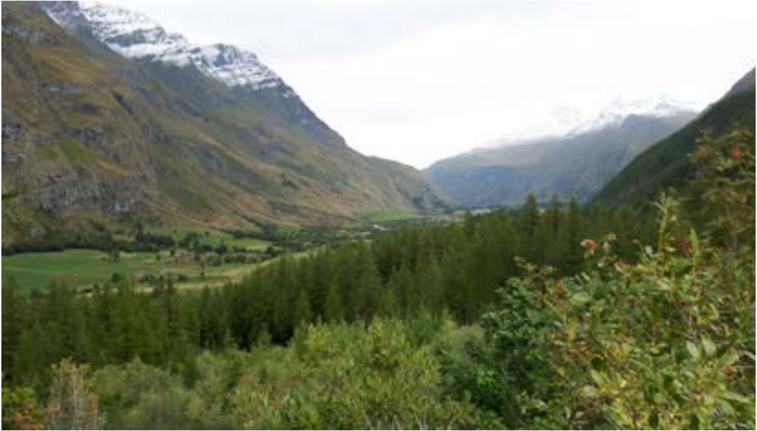
Gönguferð um skóga og fjallasali í nágrenni Lanslebourg.

Var nú haldið á brekkuna að nýju en áð við uppistöðulónið Lac de Roselend en það ku hafa nær staðið á þurru þegar þeir félagar Kristján og Gabriel fóru um svæðið um miðjan maí. Síðan var ekið sem leið lá í átt að Mekka skíðaiðkunar hér í Frakklandi, bænum Val d'Isère. Þar eru mikil skíðamannvirki, hótél á hótél ofan, skíðalyftur og kláfar þvers og kruss. Líklega ofbyði nú einhverjum þessi helgispjöll á heiðinni en hér er það veturinn og túrisminn sem skapar auð og hagsæld. Á sumrin er einnig aukin notkun á þessum mannvirkjum af hjólreiðamönnum sem láta sig gossa niður snarbrattar hlíðarnar. Að þessu sinni var ekki tími til að stoppa heldur gjóuðum við augum á landið, fjöllin og fyrirferðarmikil mannvirkin gegnum bílrúðuna. Gerður var stuttur stans við einn mjaltabásinn þar sem teknar voru myndir en ekki áð fyrr en efst í skarðinu Col de l'Iseran í 2.770 metra hæð. Þar var hálf hryssingslegt, innan við 2 gráður og rigningarlegt að sjá til vesturs, enda kom á daginn að snjóað hafði í fjöll þá nóttina.