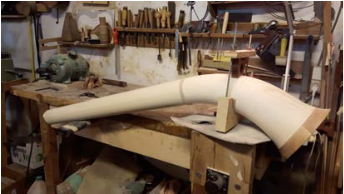
Til að skapa gott hljóðfæri má hins vegar engu skeika.