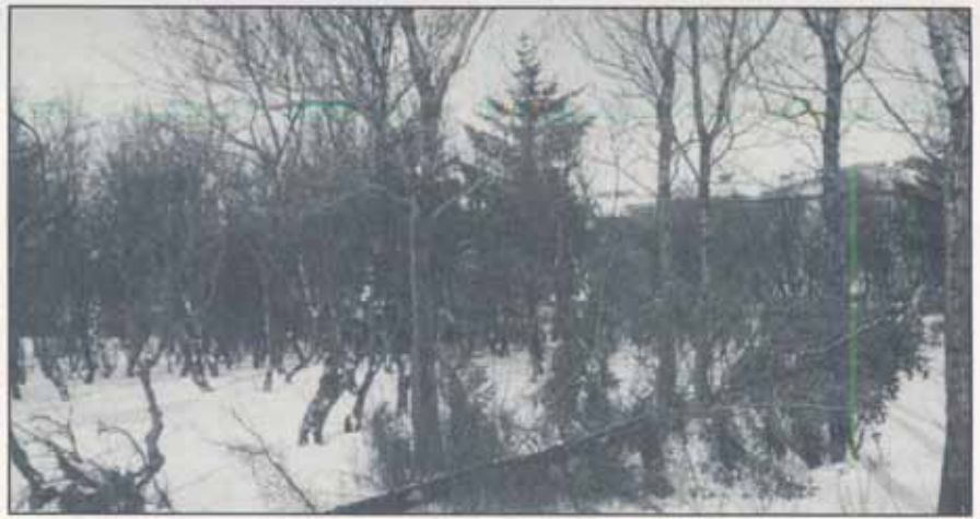
Stormfallið grenitré í Hljómskálagarðinum í Reykjavík.

Vel tókst til með geymslu birkiplantna s.l. vetur hjá okkur í Skógræktarfélagi Garðabæjar. Félagið stóð uppi með 100 bakka af birkiplöntum s.l. haust, sem ófært var að gróðursetja vegna þess hve lélegar þær voru. Tókum við það ráð að raða bökkunum þétt undir stór grenitré í garði einum. Þar höfðu plönturnar skjól, gott loft og raka. Komu plöntur þessar vonum frammar undan vetrarskjólinu. Nú eru umræddar birkiplöntur komnar niður í jörð, þar sem þeim var ætlað í upphafi.