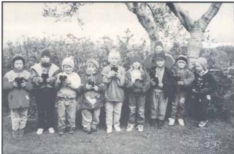
Börnin með plöntur sem þau ræktuðu sjálf og verða geymdar í skjólkassa í vetur og gróðursettar næsta vor.

Þar sem tilraunin tókst vel er ætlun okkar að halda þessu verkefni áfram.