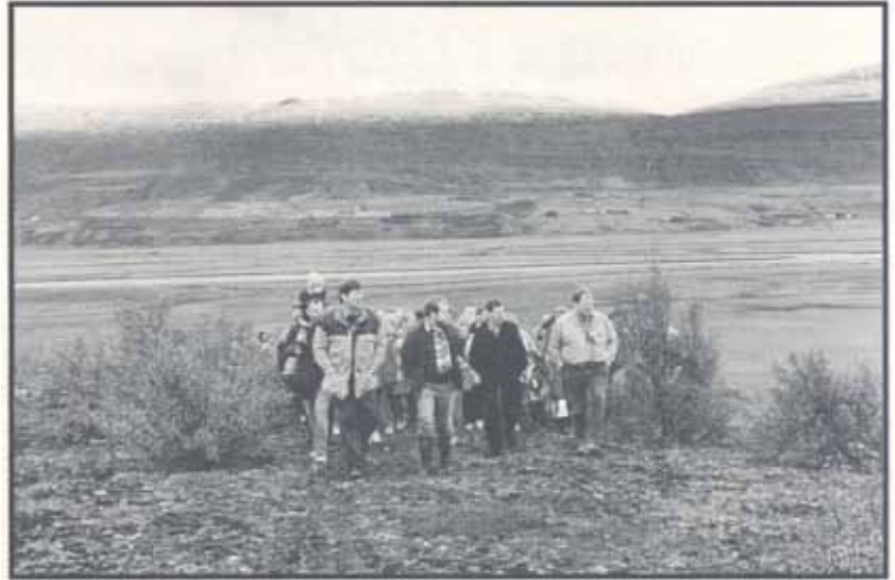
Í tilefni af 40 ára afmælinu var útivistarfólki boðið í gönguferð um Kjarnaskóg. Gengið var um skóginn í 2 tíma. 100 manns komu í gönguna.

Árið 1972 gerðu Akureyrarbær og Skógræktarfélag Akureyrar með sér samning um rekstur útivistarsvæðis í Kjarnalandi. Skógræktarfélagið afhenti bænum svæðið nær fullplantað en tók að sér að sjá um skipulagningu og framkvæmdir við að gera Kjarnaland að útivistarsvæði fyrir bæjarbúa. Því starfi hefur síðan verið haldið áfram í samvinnu við umhverfis-