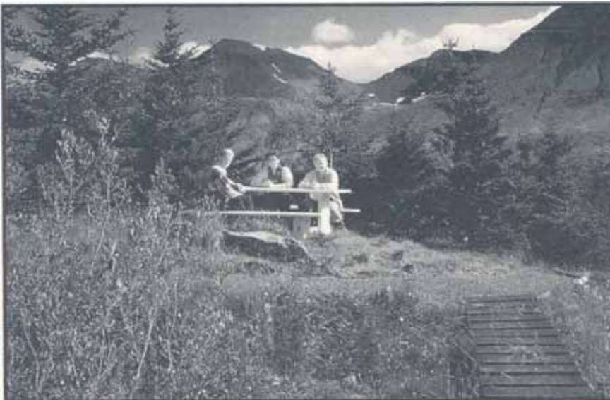
Frá svæði Skógræktarfélags Siglufjarðar í Skarðsdal, sem fékk styrk úr Pokasjóði Landverndar.

Skógræktarfélagin í landinu hafa fengið úthlutað úr Pokasjóði Landverndar síðastliðin 3 ár um 13 milljónum króna. Þessum peningum hefur verið varið til ýmissa verkefna hjá félagunum og hafa styrkirnir verkað eins og vítamínsprauta á starfsemi þeirra að undanförunu. Sérstaklega hefur verið ánægjulegt hvað mikið fé hefur verið veitt til þess að gera skógræktarsvæði félaganna aðgengileg almenningsi, t.d. með göngustígum og annarri aðstöðu. Fyrir vikið er myndarlegum útivistarsvæðum á vegum félaganna sífellt að fjölga. Skógræktarfélagin vilja þakka samtökunum Landvernd þennan mikla stuðning og vonast til að eiga við þau gott samstarf í framtíðinni.