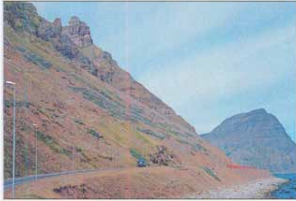
Mynd 2. Vegurinn fyrir Óshlíð sumarið 2001. Eins og sést er lúpínan farin að vaxa frá fjöruborði upp í efstu skriður. Núna er áhugavert að reyna að koma trjágróðri þarna á legg.

Í haustblaði Laufblaðsins árið 1995 var fjallað um tilraunir Vegagerðarinnar á Vestfjörðum til þess að binda lausar skriður í Óshlíð með uppgræðslu. Laufblöðungur sem þar var á ferð skrifaði þá: „Til að reyna að binda lausagrjót og skriður uppi í hlíðinni hefur Vegagerðin gert tilraun með að sá alaska-