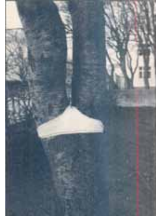
Þessi fallega gyðja stakk sér niður í garð Skógræktarfélags Íslands núna í vetur (Mynd JGP).

Framlag Gunnhildar kallast „Dætur moldarinnar“. Þar dregur hún athygli að gömlum, vöxtulegum trjám í gamla bænum í Reykjavík. Trén klæðir hún í blúndunærbuxur, þar sem bolur trjánna greinist. Þannig stingast dætur moldarinnar upp úr jörðinni með fætuma á undan. Nektin verður fyrst eftirtektarverð þegar búið er að hylja hana í nærbuxunum.