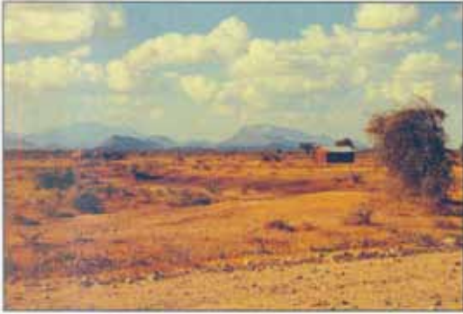
Hnignun landkosta er víða mikil í sunnanverðri Afríku, ekki síst í hinu svokallaða Sahel-svæði á suðurjaðri Sahara-eyðimerkurinnar. Þessi mynd er tekin í N-Kenýa, í átt að landamærum Súdan. Á þessu svæði hefur hnignun landkosta haft mikil áhrif á möguleika fólks að fæða sig og klæða.

Í ársskýrslu Landgræðslu ríkisins fyrir árið 2001 er umfjöllun um efni sem Laufblaðið vill vekja athygli lesenda á. Þar reifar Sveinn Runólfsson landgræðslustjóri hugmyndir í þá veru að þekking okkar Íslendinga á eyðingu gróðurs og jarðvegs og endurreisn landkosta geti nýst í tengslum við þróunaraðstoð, líkt og er nú varðandi eldvirkni, jarðhita og fiskveiðar.