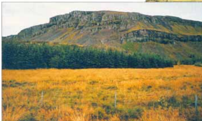
Djúpivogur árið 2002. Sitkagrenið búið að ná sér að mestu.

hins vegar til að halda trénu á lífi og með árunum bætast síðan nýir sprotar við og þá fer að bera minna á þessum skemmdum eftir því sem tréð bætir nýjum sprotum utan á krónuna og eftir 4-5 ár eru þessar skemmdir væntanlega mikið til horfnar. Það fer þó eftir aðstæðum“.