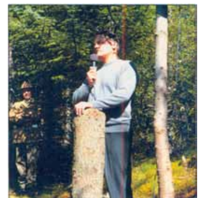
Guðni Ágústsson landbúnaðarráðherra kynnti framlengingu samningsins fyrir skógræktarfélagi í Danielslundu.