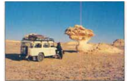
Eyðimerkur þekja nú stóran hluta Íslands. Sama er upp á teningnum víða meðal fátækra ríkja. Er úr vegi að við gætum tekið að okkur að miðla reynslu af vettvangi uppgræðslu og skógræktar til annarra ríkja? Myndin er tekin í eyðimerkurríkinu Egyptalandi, nærri landamærum Líbýu.

Þetta er framsækinn og áhugaverð hugmynd hjá Landgræðslunni. Á þessum vettvangi höfum við miklu að miðla, enda nú um 100 ár síðan starf af þessu tagi hófst hér á landi.