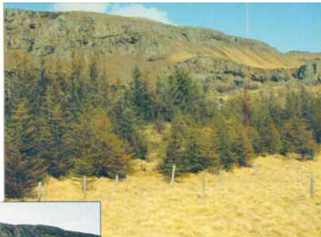
Djúpivogur árið 1992. Sitkalúsarfaraldur nýgenginn yfir.

Þetta er vegna þess að lúsin tekur bara gömlu nálarnar og tréð á alltaf nægan forða til að skjóta nýjum sprota að vori. Nýi sprotinn er varinn fyrir lúsinni, auk þess sem lúsinni fækkar alltaf þegar tré vakna úr dvala og byrja að vaxa.