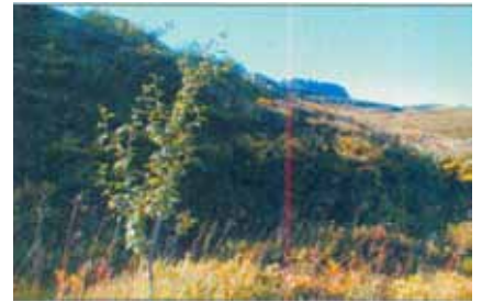
Notkun á tilbúnum áburði eykur mjög lífslíkur og vöxt nýgróðursettra plantna.

Einnig eru til áburðartegundir með sömu efnum sem kallast seinleystar. Þá er áburðurinn húðaður með efnum sem leysast hægt upp og er því aðgengilegur plöntunum yfir lengri tíma. Núna er á markaðnum blanda hefðbundins áburðar og seinleysts áburðar sem nefnist Gróska og hentar sérlega vel með skógarplöntum.