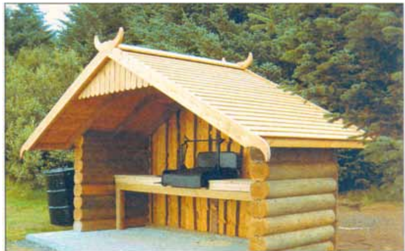
Í Sólbrekum er einn fallegasti skógalundur á Suðurnesjum. Þar er byrjað að byggja upp útvistaradstöðu og skógurinn orðinn fjölsóttur áningarstaður. Grillhúsið sést hér á myndinni.

Hliðar hússins eru byggðar úr bjálkum en gaflinn er úr íslensku greni. Bjálkarnir eru afgangur úr innfluttu finnsku bjálkahúsi sem var reist í bænum en gaflinn er úr íslensku greni. Efnið í það fékkst úr stórum jólatrjám bæjarins, en eftir að þau höfðu gegnt sínu hlutverki yfir jólin var bolnum flett niður í sver borð og timbrið notað til að klæða gaflinn á húsinu.