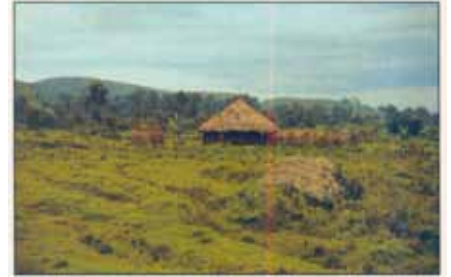
Eyðing skóga og hnignun landkosta er víða vandamál í þriðja heiminum. Myndin er tekin í austurhluta Lýðveldisins Kongó (áður Zaire) þar sem skógar hafa verið höggðir miskunnarlaust og land víða rofnað í kjölfarið.

ríkisins og landbúnaðarráðuneytisins. Á vegum verkefnisins hafa verið gróðursettar um 1 milljón trjáplantna árlega síðan árið 1990 þegar því var hleypt af stokkunum í tilefni 60 ára afmælis Skógræktarfélags Íslands. Nú er gróðursett á um 120 svæðum á landinu og ná samningar yfir um 12.000 hektara lands. Í öllum samningum Landgræðsluskóga er ákvæði um frjálstan aðgang almennings þannig að í framtíðinni munu þarna skapast umfangsmikil útivistarsvæði um allt land. Víða eru skógræktarfélag einmitt farin að vinna að slíku, nú þegar góður árangur ræktunarinnar er farinn að blasa við.