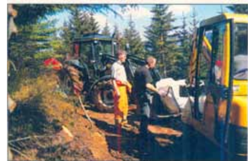
Unnið hefur verið að gerð göngustíga í skógi Skógræktarfélags Ísafjarðar í Tungudal. Hluti stíganna á að vera svo breiður að þeir geti nýst sem skíðagöngubrautir í skóginum á veturna. Hér eru Ísfirðingar á fullu við að bæta aðgengið að Tunguskógi.

Fyrirtækin lögðu fram rausnarlega fjárupphæð til þess að útbúa aðgengi að skógum skógræktarfélaganna. Eins og lesendur Laufblaðsins vita, var byggð upp góð aðstaða fyrir almenning í skógi Skógræktarfélags Borgarfjarðar, Daníelslundi, í fyrra. Sívaxandi fjöldi fólks heimsækir Daníelslund og samkvæmt upplýsingum frá Skógræktarfélagi Borgar-