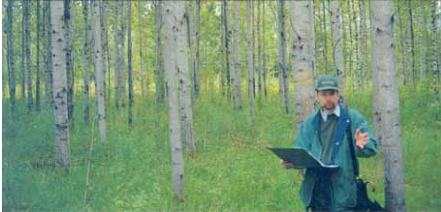
Fallegir blæsparræður ( Populus tremula x P. tremuloides ) í Finnlandi.

Um þessar mundir er asparviður eftirsóttur á Norðurlöndunum. Sérstaklega er það pappírsiðnaðurinn í Finnlandi og Svíþjóð sem er áhugasamur um þetta hráefni, enda asparviðurinn ljós og þeirrar gerðar að henta vel til framleiðslu á hágæðapappír.