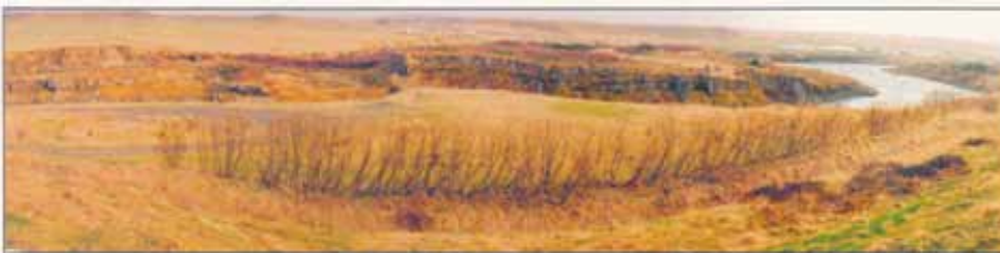
Framkvæmdir í og við Hrótey við Blönduós eru hafnar. Hrótey er náttúruperla í Blöndu, rétt við Blönduós.