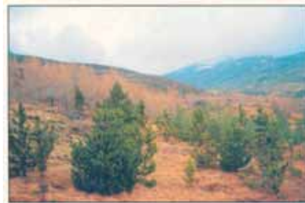
Skógræktarfélag A-Skaftfellinga á jörðina Haukafell á Mýrum. Þar hefur félagið ræktað skóg undanfarna áratugi, með góðum árangri. Þar vaxa nú fallegir teigar ýmissa trjategunda. Svæðið býður upp á einstaklega fjölbreytta úti-vistarmöguleika á hálendisbrúnni, skammt austan Fláajökuls. Félagið er að hefjast handa við að byggja upp útivistaraðstöðu í skóginum og gera hann aðgengilegan almenningi. Pokasjóður styrkir félagið nú í ár til þess.

Nú á dögnum úthlutaði Pokasjóður verslunarinnar skógræktarfélagunum myndarlegum fjárstyrk. Úthlutaði sjóðurinn 4 milljónum króna til ýmissa verkefna skógræktarfélaganna. Stjórn Skógræktarfélags Íslands sá um að úthluta þessum fjármunum til einstakra verkefna og sýnir meðfylgjandi tafla hvaða verkefni fengu styrk að þessu sinni. Þessu til viðbótar styrkti Pokasjóður framkvæmdir í Vinaskógi