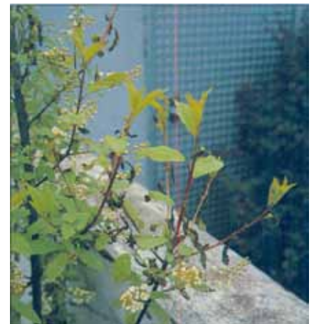
Þessi heggur í vesturbænum í Reykjavík var orðinn töluvert útsprunginn áður en hretið gerði. Hann tapaði nokkru af laufi í hretinu, en vejjaskemmdir virðast engar, enda uxu út heilbrigðir sprotar eins og ekkert hefði í skorist. Einnig blómstraði hann eðlilega. Ef myndin prentast vel sjást hins vegar dauðu laufin enn hangandi á trénu.

Enn er ekki hægt að segja endanlega til um hversu alvarlegar afleiðingar hretsins verða. Mikilvægt er hins vegar að reyna að lesa úr áhrifum svona hrets á trjágróðurinn. Á vegum Rannsóknastöðvarinnar á Mógilsá er hafin skipulögð vinna við mat á skemmdunum. Niðurstöður þeirrar vinnu liggur ekki fyrir enn, en við munum leitast við að segja frá því hér í Laufblaðinu þegar þar að kemur.