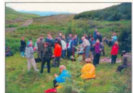
Skógargöngur eru haldnar á sumrin. Göngurnar í sumar hafa verið vinsælar eins og sést á þessari mynd frá Fossá í göngu á vegum Skógræktarfélags Kjálarness, þar sem endað var á grillveislu.

Í haust eru eftirfarandi viðburðir á dagskrá: