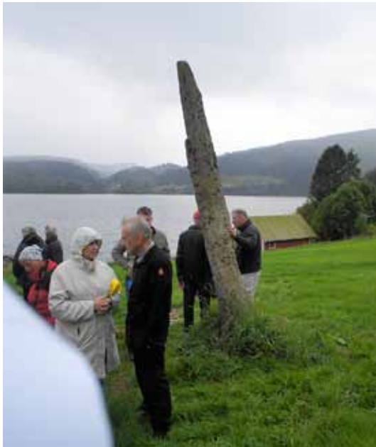
Bautasteinninn við lendinguna í Hrifudal.

í nokkrar kynslóðir áður en þær voru skráðar. Ekki var laust við að neistaði á milli hennar og heimamanna sem lifðu sig inn í söguna eins og við þekkjum svo vel í eigin ranni.