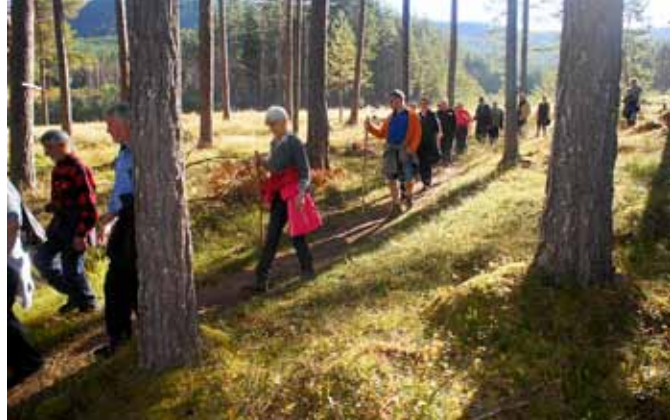
Gengið um Amlaskogen.