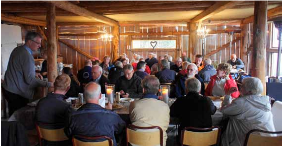
Víkingasúpa snædd í hlöðunni á Rytnetunet.