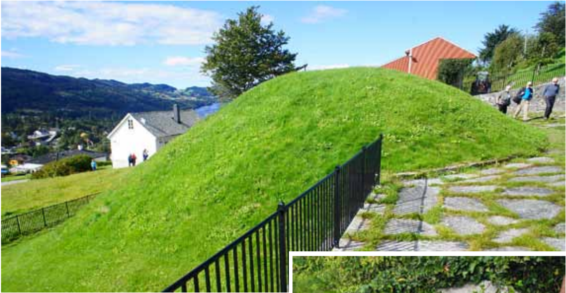
Kunungsgröfin í Sæheimi sem talin er vera gröf Hákonar hins góða Aðalsteinsfóstra (d. 961 e. Kr.).

flutningi beykisins til Sæheims en með DNA-samanburði hefur hann verið rakinn til Danmerkur. Tilgangurinn hefur væntanlega verið að nýta skóginn sem beitarnland fyrir svín og útvega verðmætan smíðavið á konungssetrinu. Nú þekur beykiskógur um 20 hektara og hefur hann skyggt út aðrar trjátegundir og ofurhægt lagt undir sig stærra svæði. Um sjö hektarar af skóginum eru nú náttúruverndarsvæði og heitir sá hluti Vollom, sem trúlega hefur sömu merkingu og Völlur. Hæstu trén eru um 25-30 m og gæðin þökkaleg, þótt þau keppi ekki við beykivið vaxinn í mið-Evrópu.