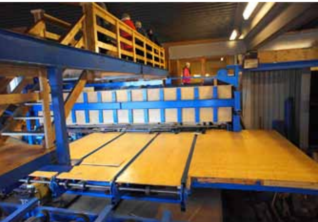
Flokkunarlína í nýju sögunarmyllunni í Innrihúsum.

til sektarkenndar vegna frændsemi við þá er landið byggja. Ljónsi punkturinn hefði verið að sjá og upplifa þessa fáu, smáu en vöxtulegu skóga sem gæddu landið lífi á ný og þá virðingu, umhyggju og áhuga fyrir skógunum sem þau höfðu orðið áskynja í ferð sinni.