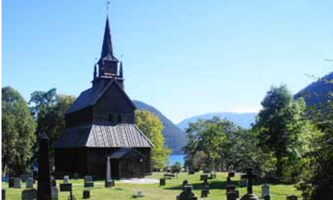
Stafkirkjan í Kaupanger. Byggingarár er talið vera 1137.