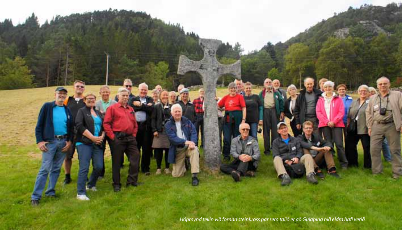
Hóprmynd tekin við fornan steinkross þar sem talið er að Guláping hið eldra hafi verið.