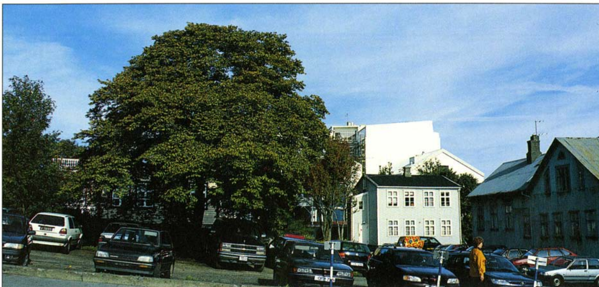
Bífreiðum lagt þétt að álminum. Séð frá Túngötu.