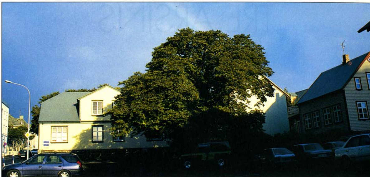
Krónan hefur töluvert umfang og slútir langt niður.