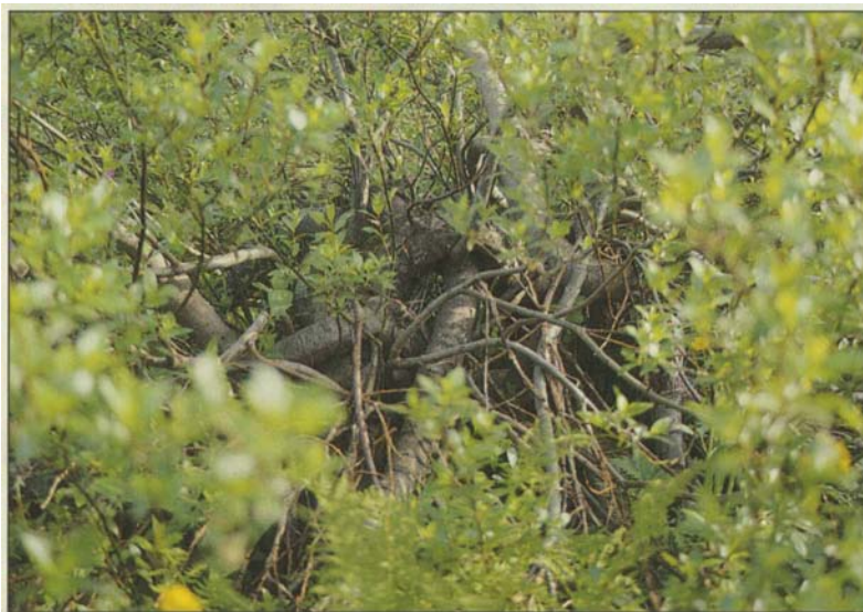
Gamla móðurtréð hefur margbrotnað í snjó í gegnum árin.