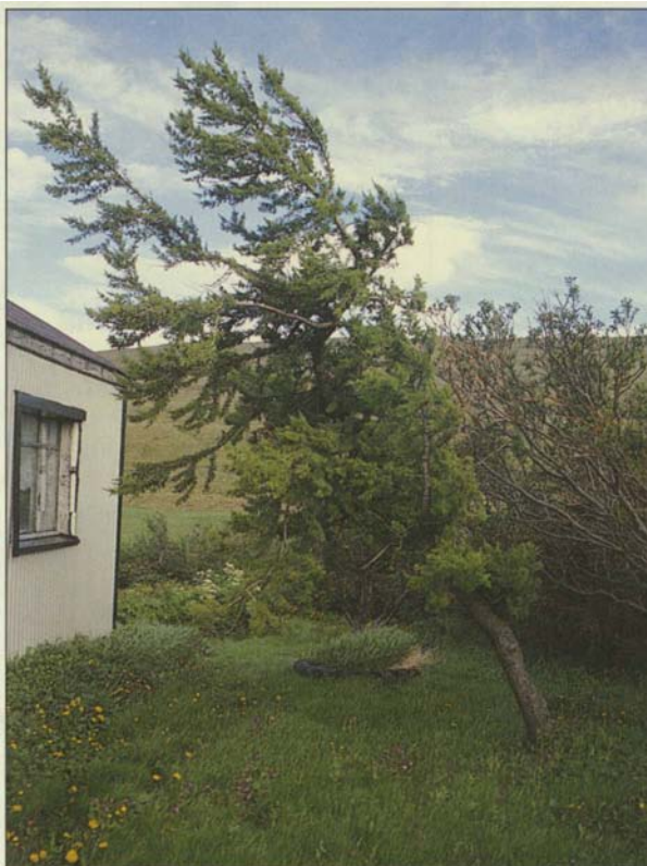
Í garðinum við Tröllatungu vaxa ýmsar trjátegundir, þetta lerkitré hallast undan þungri landáttinni.