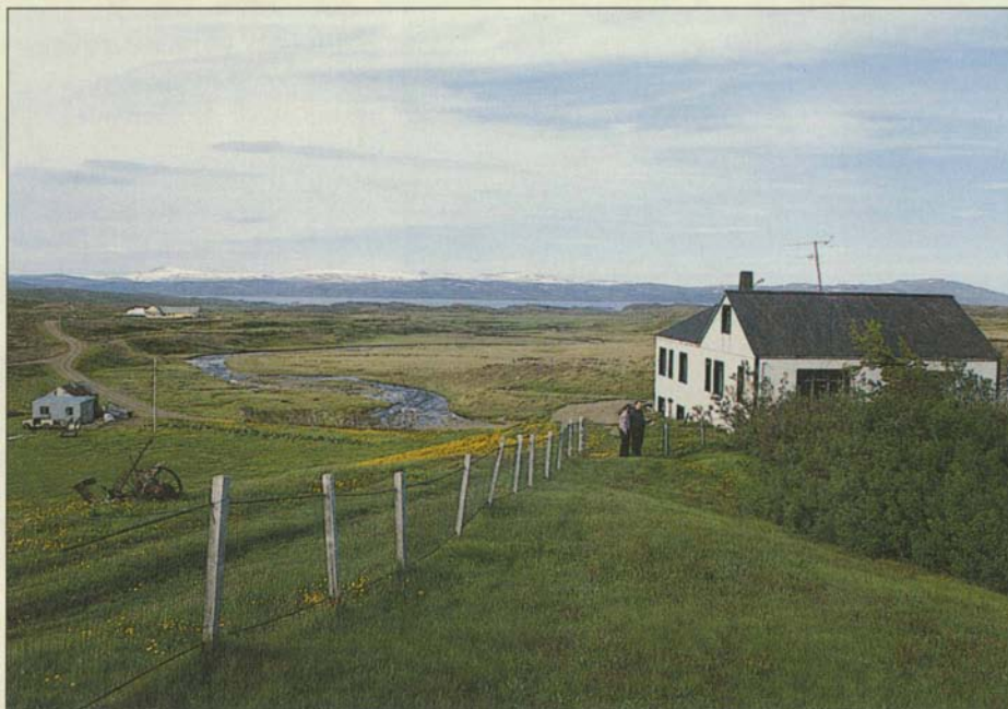
Samsíða heimilisgarðinum í Tröllatungu er kirkjugarður. Strandavíðirinn hefur verið gróðursettur í báða garðana. Hér er horft norður yfir bæinn.

frambyggðan rússa- jeppa Skógræktar ríkisins af víðisprotum! Sá víðir var fyrst tekinn til fjölgunar í gróðrarstöðinni í Norðtunguskógi í Þverárhlið, en dreifðist síðan þaðan til ýmissa ræktenda. Því hefur nafnið „Tröllatunguvíðir“ stundum verið notað yfir strandavíðinn.