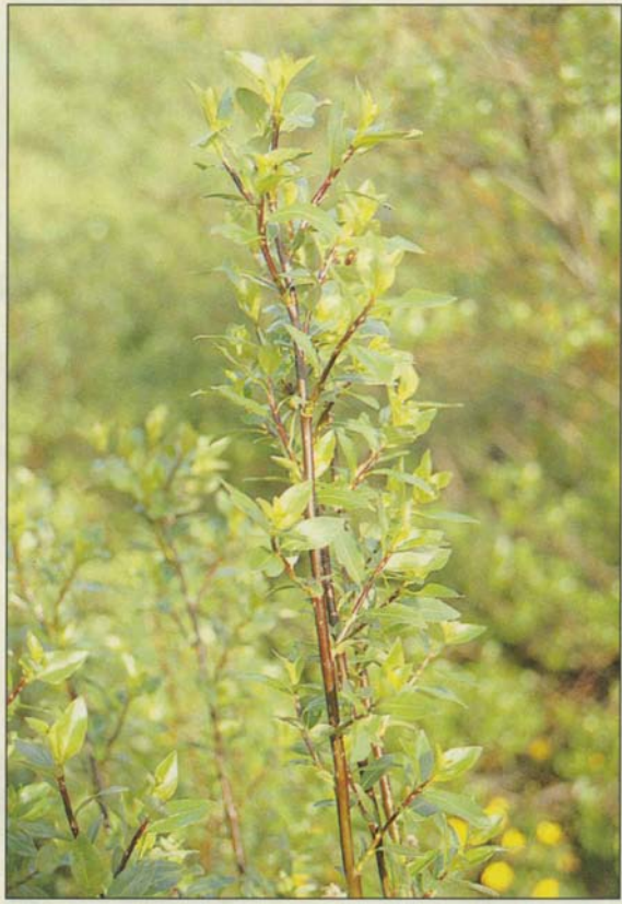
Strandavíðirinn er afar blaðfallegur, með dökkgræn, glansandi blöð og brúnleitan sprota. Hann hefur reynst afar harðgeri í ræktun víða um land.