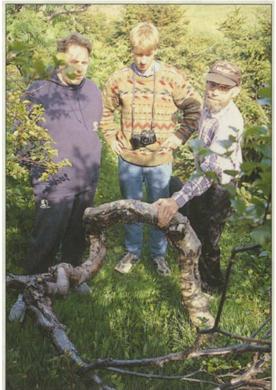
Þetta birkitré hefur látið undan snjóþyngslunum í garðinum og fengið þetta sérstaka vaxtarform.