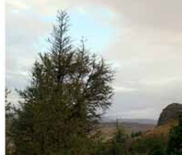
7. mynd. Tré ársins 2014 og Valsholuklettur til hægri.

Kort danskra landmælingamanna af Arnarholti Árið 1910 unnu danskir landmælingamenn við landmælingar í Stafholtstungum. Það er langt í frá eina verk þeirra hér á landi, því dönsku landmælingamennirnir unnu hér mikið afrek í því að gera nákvæmt landmælinganet og kortaútgáfu af Íslandi á árunum 1900 til 1940, en það er önnur saga. Kortið sem þeir teiknuðu af Arnarholti og Hlöðutúni hefur varðveist. Gróðursetningin er merkt inn á kortið með örnefniinu Lundur (með stórum staf). Hægt er að nálgast kortið á vef Landmælinga Íslands 4 .