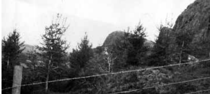
6. mynd. Lundurinn í Arnarholti laust fyrir 1930.