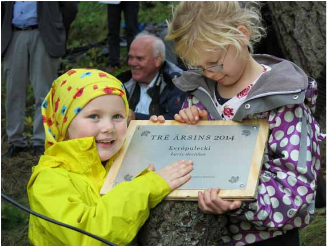
2. mynd. Skilti sem markar Tré ársins 2014 afhjúpað við hátíðlega athöfn þann 14. september 2014.