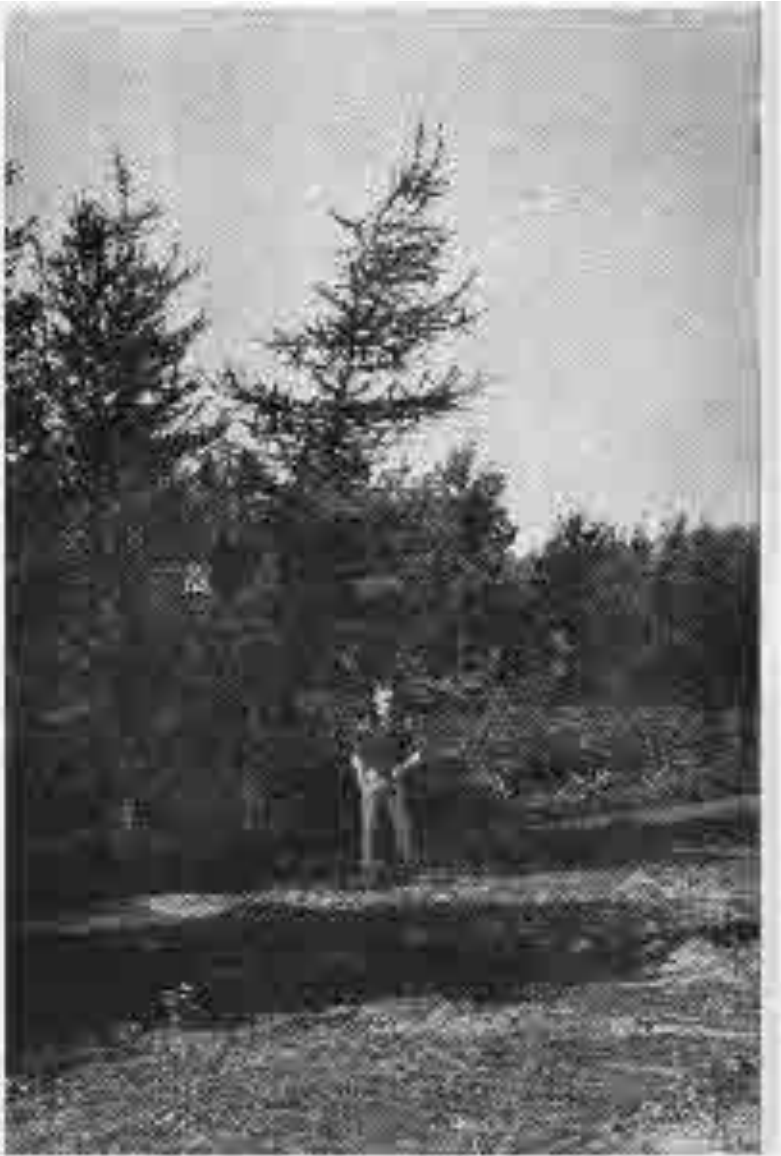
Lerki Mörkinni á Hallormsstað. Hæð um 6 m.