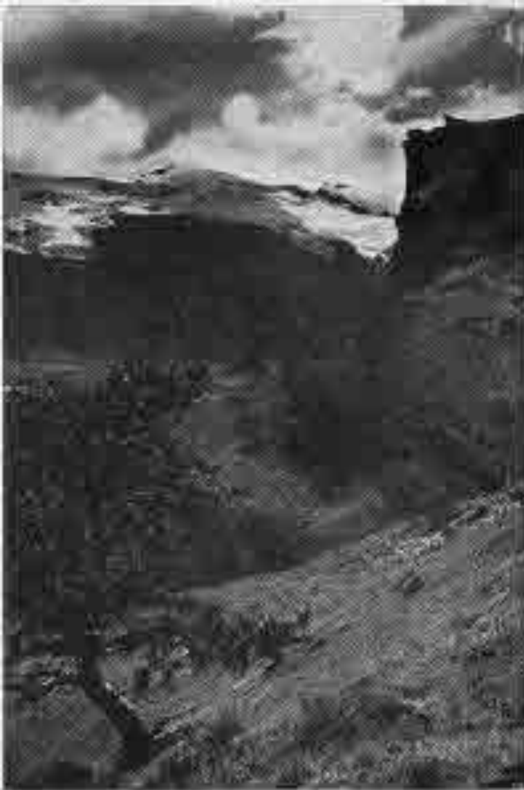
Úr Langadal í Þórsmörk.