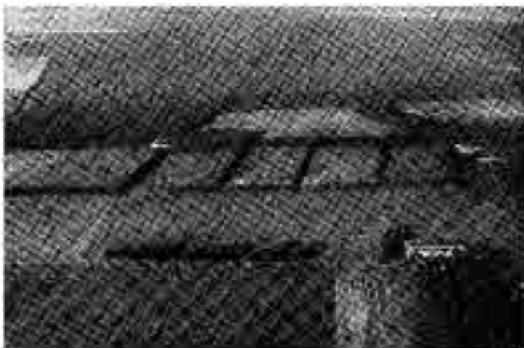
Gyttegaard skógur. Áður var þetta land ófrjó heiði. Takið eftir limgörðunum á ökrunum.

ekki, hversu mikið sem vindurinn færist í aukana, heldur verður eftirtekja ræktaða landsins drjúgum meiri vegna skjólsins. Tilraunir hafa leitt í ljós, að slægjulönd t.d. jóku heyfall sitt upp undir 20-30% vegna skjólsins.