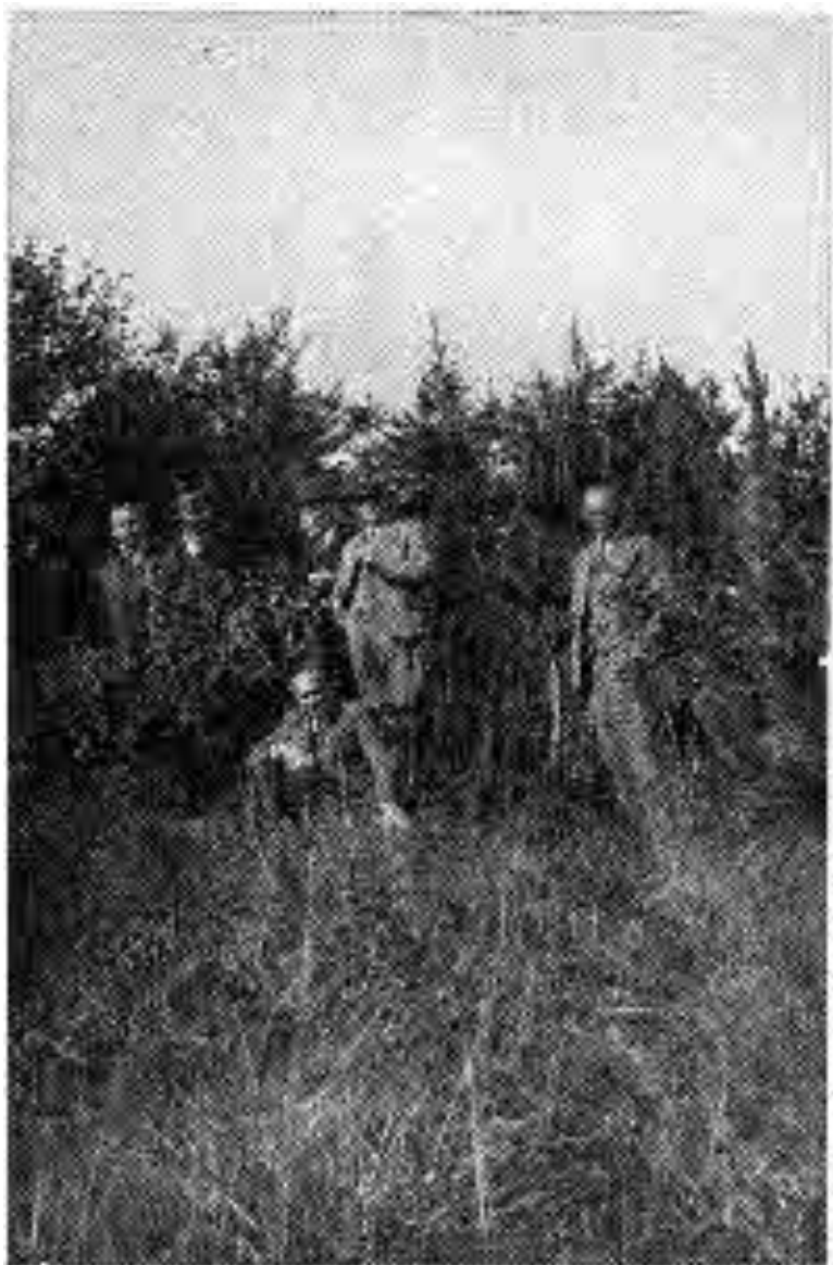
Úr stöðinni við Grund í Eyjafirði 1936. 30 ára lerki og fura.