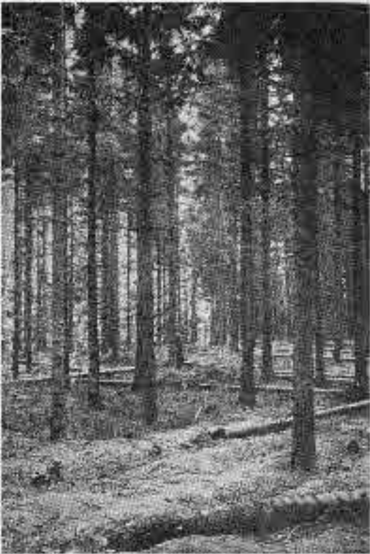
Hógildgaard skógur, gróðursettur 1873. Hæð trjánna 1930 18,2 m.