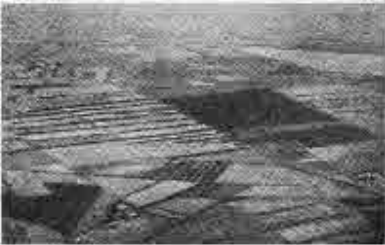
Söby og Falsterholt. Áður frjó og strjálbyggð heiði, nú þjett setin og vel ræktuð. Limgarðar við hvern akurteig.

plantnanna og kom þá á daginn, að furan varð einskonar fóstura grenisins, því að henni tókst skjótt að þekja jarðveginn og þá fór grenið að vaxa.