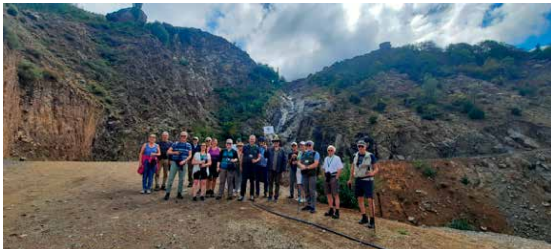
Mynd af gönguhópnum sem stóð sig með þrýði.