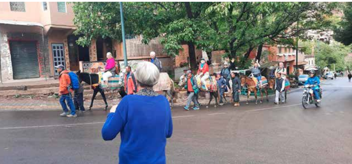
Hópur ferðafélaga á múlösum leggur í ferð upp snarbrattar bliðar.