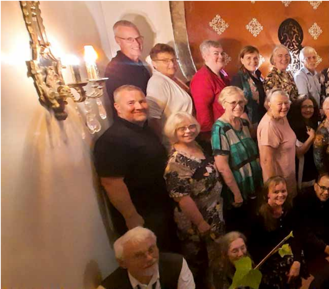
Hópmýnd af ferðalöngum í lok ferðar.