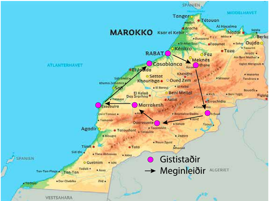
Meginleiðir sem farnar voru og gististaðir.