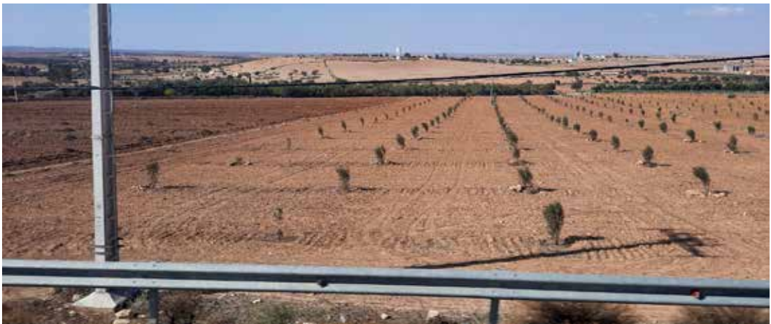
Landbúnaðarland, akurlendi þegar plægð með ávaxtatrjám inn á milli en sáning biður þar til rignir.