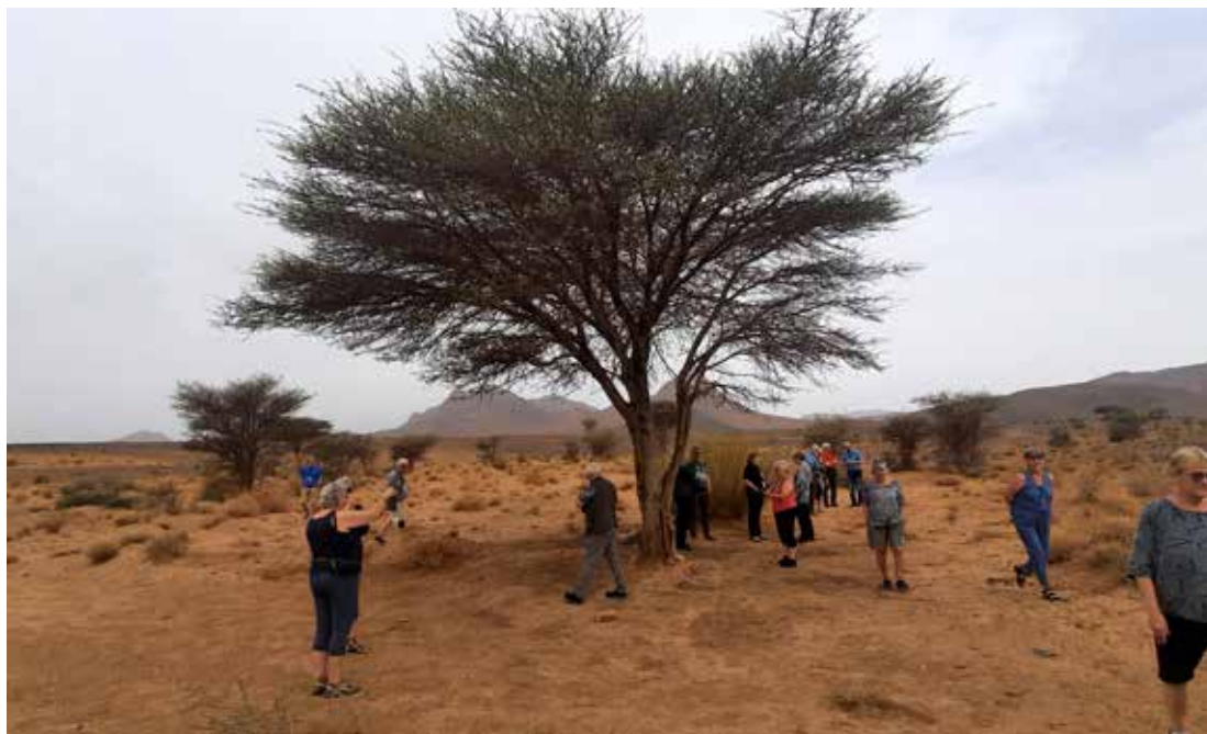
Pyrrum stráð akasútré finnast á stangli í eyðimörkinni.