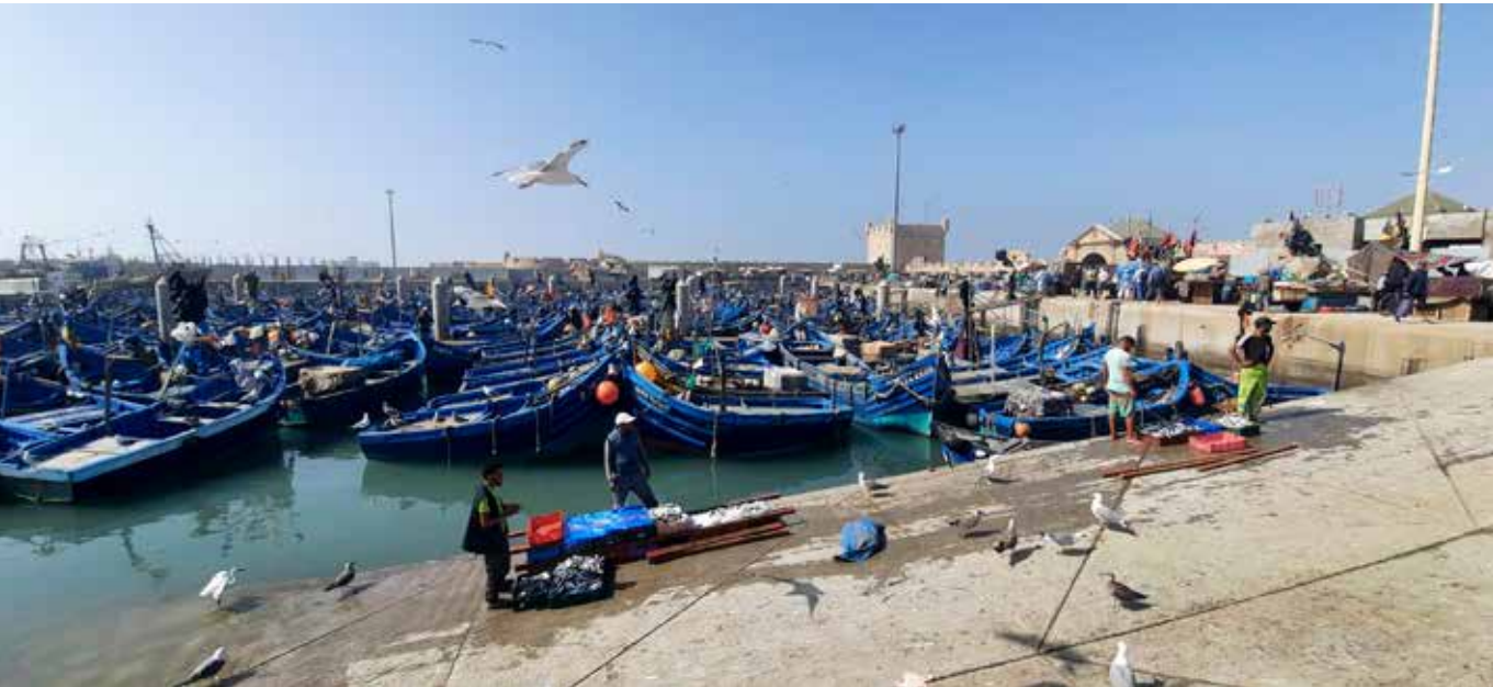
Frá höfninni í Essaouira. Sjómenn að landa afla.