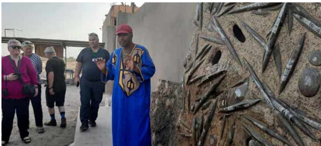
Mikið var um steingervinga á ferðaslóðum okkar og hér heimsóttum við fyrirtæki þar sem slípaðar eru steingerðar lífverur, milljón ára gamlar.