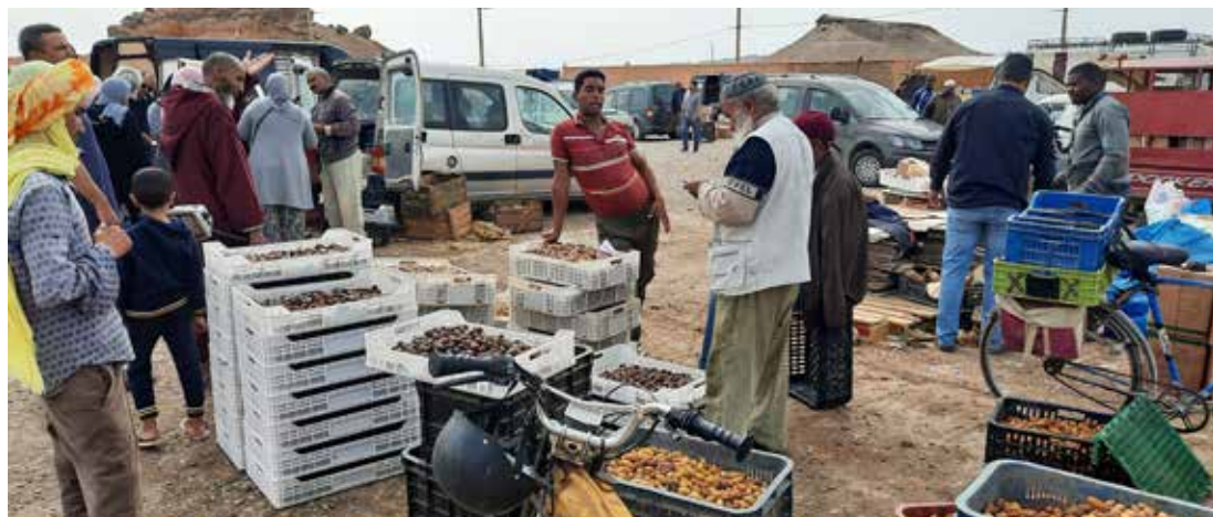
Á markaðnum var hægt að gera góð kaup á döðlum.

Snæddur var hádegisverður í veitingastað sem byggður var úr leir og hálmi (pisé) og allstaðar að sjá jarðmyndanir þar sem gat að líta á yfirborðinu frumlífverur 350-500 milljón ára gamlar.