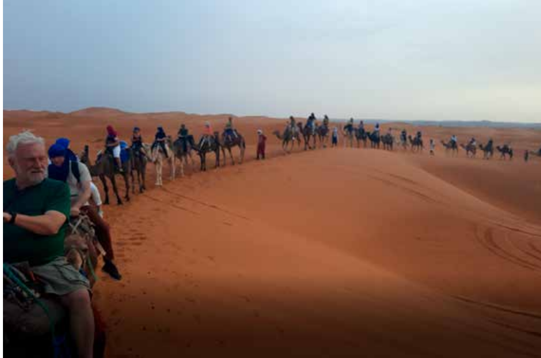
Úlfaldalestin silaðist hægt yfir sandöldurnar.