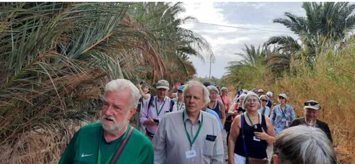
Ferðalangar skoða ræktun döðlupálma.