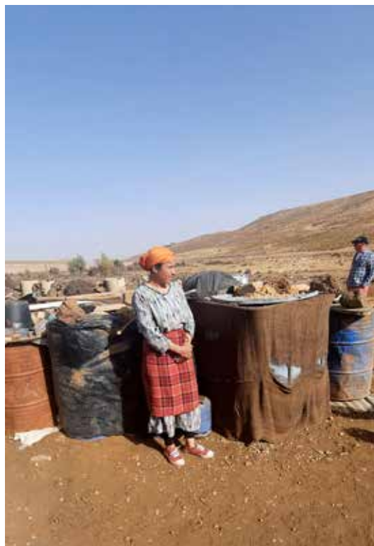
Húsmóðirin bauð upp á léttar veitingar, enda gestrisni hvarvetna sem við komum.

vatni úr á akra austan fjallgarðsins. Nú er staðan eftir þurrka síðustu mánaða að vatnið er eingöngu 1/3 af því sem eðlilegt getur talist og horfir til verulegra vandræða