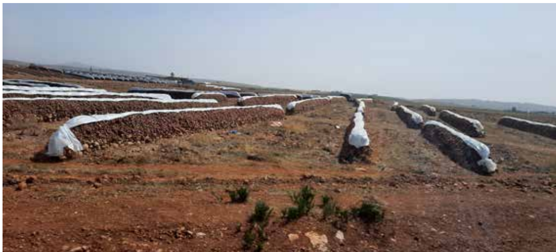
Hraukar af laukstæðum til þerris.