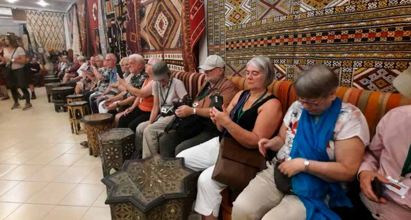
Listilega unmin teppi um alla vegg.