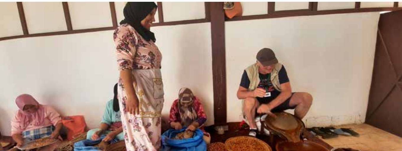
Framleiðsluaðferðir við gerð arganolíu eru mikil handavinna. Íslendingar fengu að spreyta sig með ágætum árangri. Heimakonur brostu kurteislega.

Einnig skoðuð híbýli og hallir ráðamanna (Bahia höllin) frá 19. öld þar sem er m.a. að finna fallega garða með ótrúlega fallegum skreytingum, svo ekki sé minnst á gamalt gufubað - Hammam - sem talið er að eigi rætur að rekja til tíma Rómverja sem ríktu hér við Miðjarðarhafið um aldir. Marokkóska útgáfan hefur síðan þróast á sjálfstæðan hátt og tengist m.a. trúarbrögðum og öðrum mikilvægum athöfnum eða tímamótum.