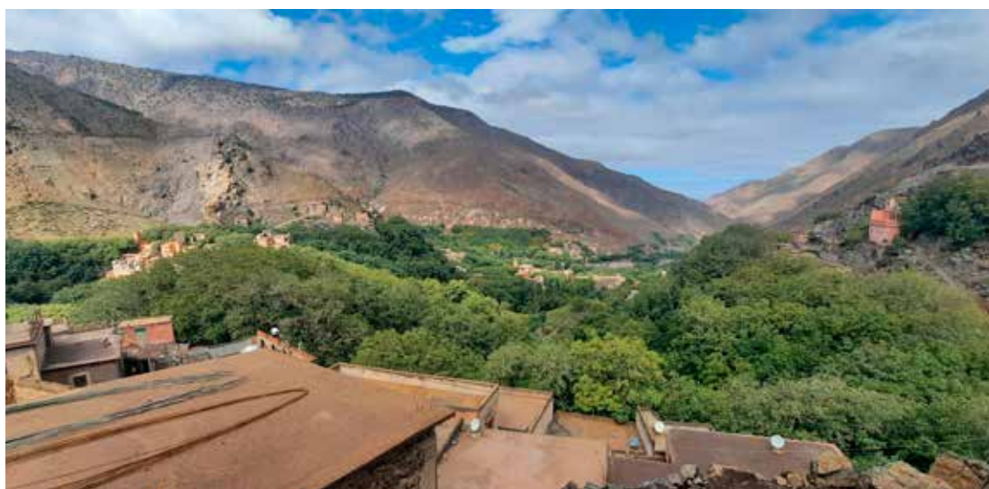
Grösugur dalur við upphaf gönguferðar en þarna vaxa og eru ræktuð valhnetutré og eplatré.