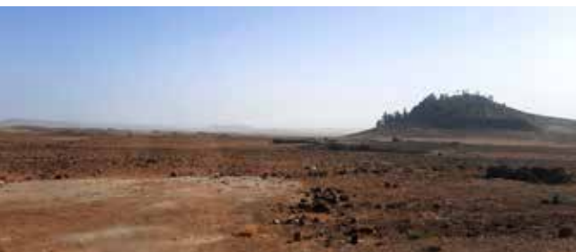
Hér eru beitar svæði Berba hirðingja og svipar landinu nokkuð til Möðrudalsöræfa. Sjá má leifar sedrusskógarins á hæðinni t.h.

Lagt var af stað í góðu veðri frá Ifrane og framundan nokkuð langur dagur þar sem lagðar voru að baki tvær fjallakeðjur, Mið- og Há-Atlas. Stoppað var í fjallaskarði þar sem tóku á móti okkur áður nefndir apar sem voru hinir gæfustu og tóku okkur fagnandi en innan hópsins er samt greinilega valdastigi sem hafður er í hávegum. Sjá mátti mikla sedrusviðarskóga en einnig leifar fyrri skóga, sem sjást sem einstaka stór tré uppi á hryggjum. Hér er