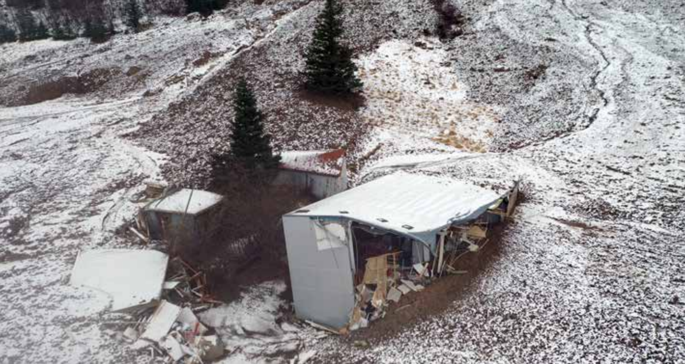
Tré ársins 2023 má sjá hér við rústir Sandfells hússins (Hafnargötu 32). Þessi tvö tré stóðu af sér skriðuna en efra tréð er horfið undir varnargarð sem gerður var í kjölfarið.

fyrir viðburðinn. Ákveðið var að halda upp á viðburðinn á Seyðisfirði sunnudaginn 10. september og dagskrá viðburðarins unnin í góðu samráði við heimamenn.