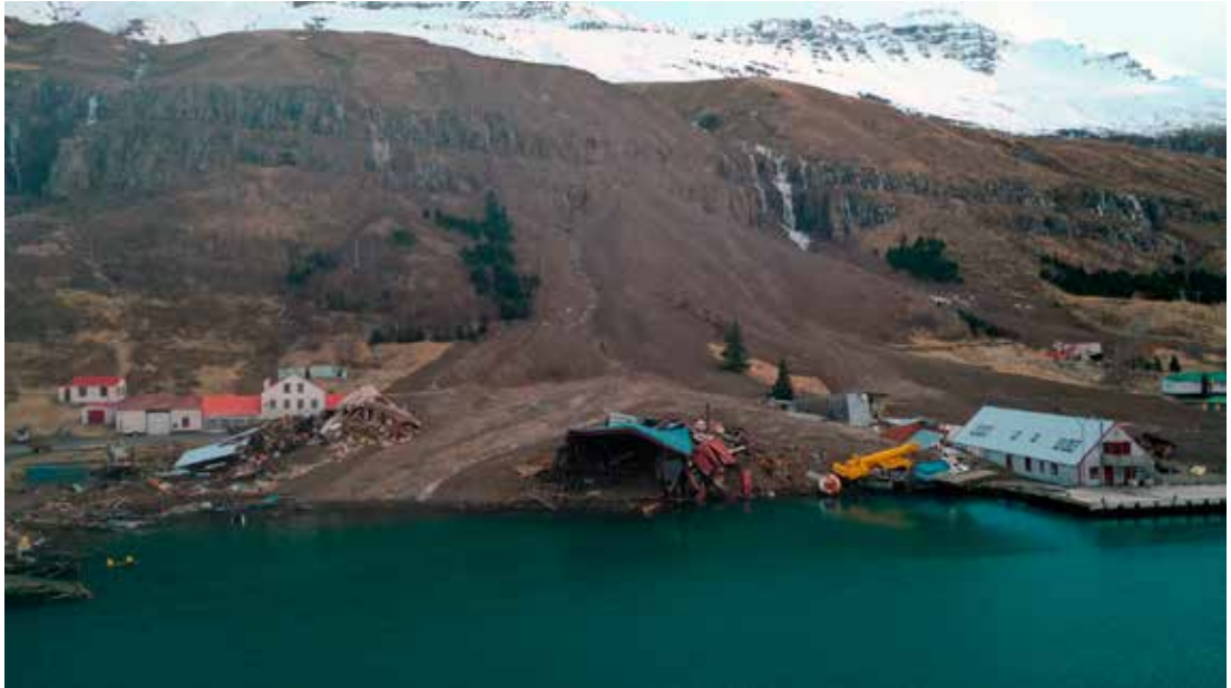
Afleiðingar skriðunnar á Búðareyri í Seyðisfirði 18. des. 2020.