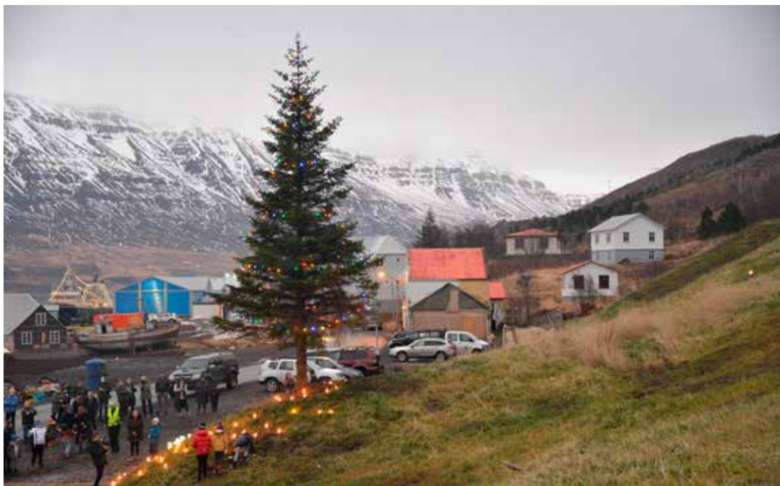
Íbúar Seyðisfjarðar hafa safnast saman á tímamótum við tréð og kveikja gjarnan á kertum. Myndin er tekin 18. desember 2021, ári eftir að skriðan féll. Mikil mildi var að enginn mannskaði varð þegar skriðan féll á sínum tíma.

þennan dag og þegar komið var til Egilsstaða með flugi var hálf hryssingslegt um að líta, aðeins fjórar gráður og þegar komið var upp á Fjarðarheiðina gránaði í rót.